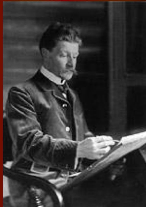
М. А. Врубель