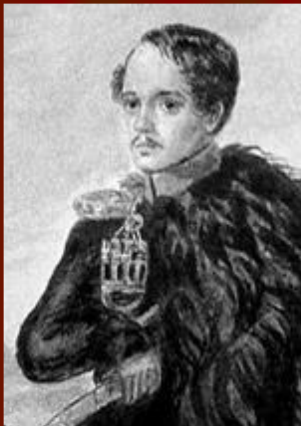
М. Ю. Лермонтов