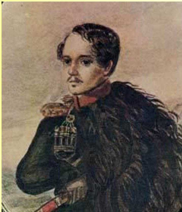
ЛЕРМОНТОВ Михаил Юрьевич