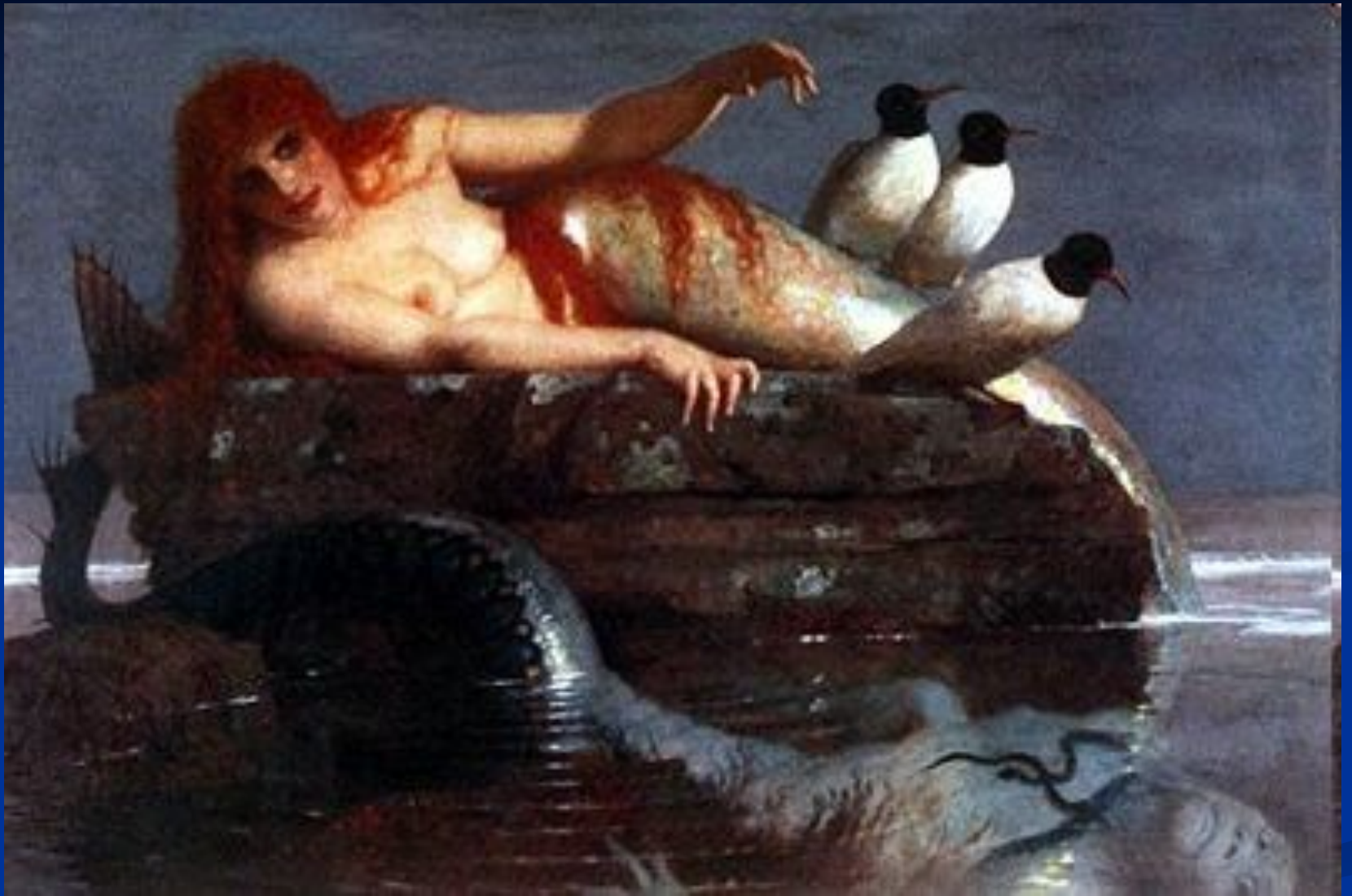
А. Бёклин. «Тихое море».