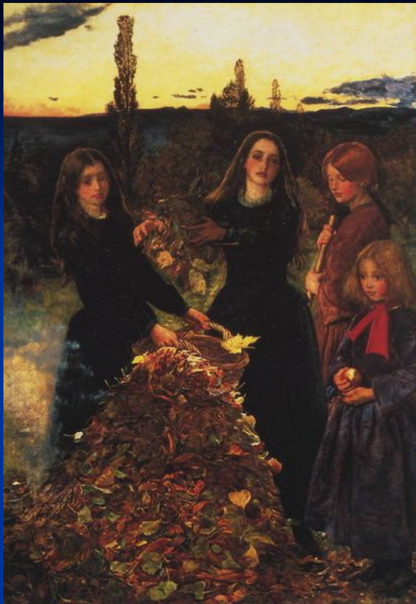
Д. Миллес. «Осенние листья».