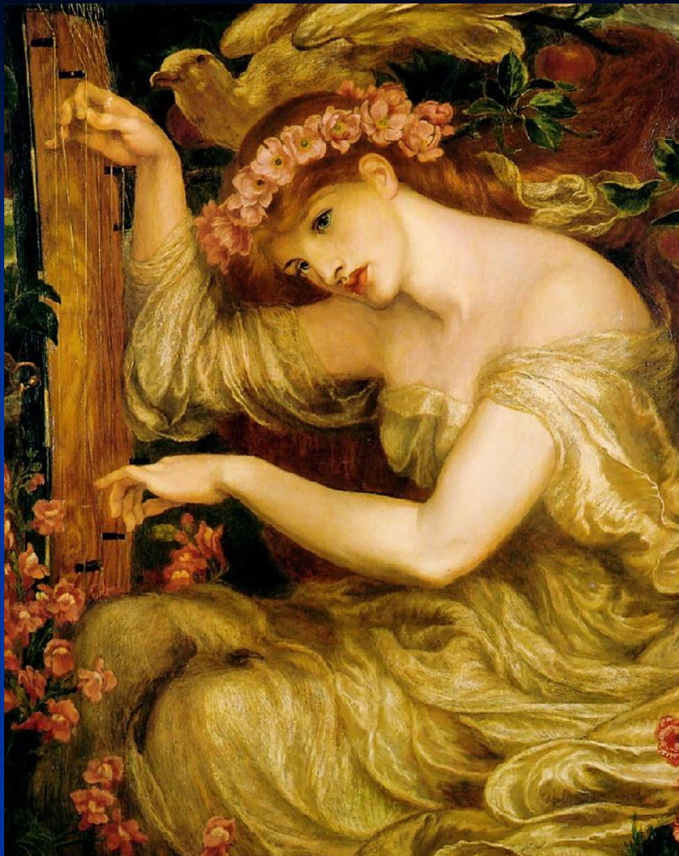
Д. Г. Россетти. «Морское заклинание».