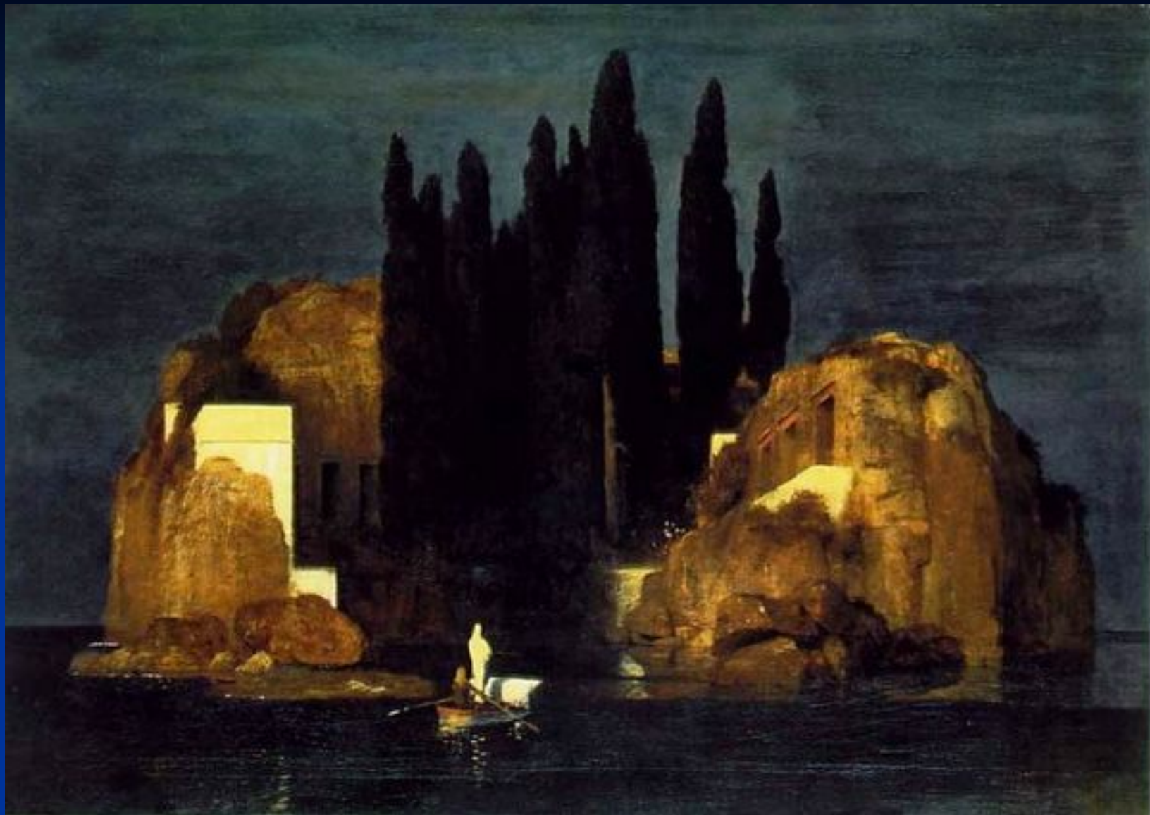
А. Бёклин. «Остров мёртвых».