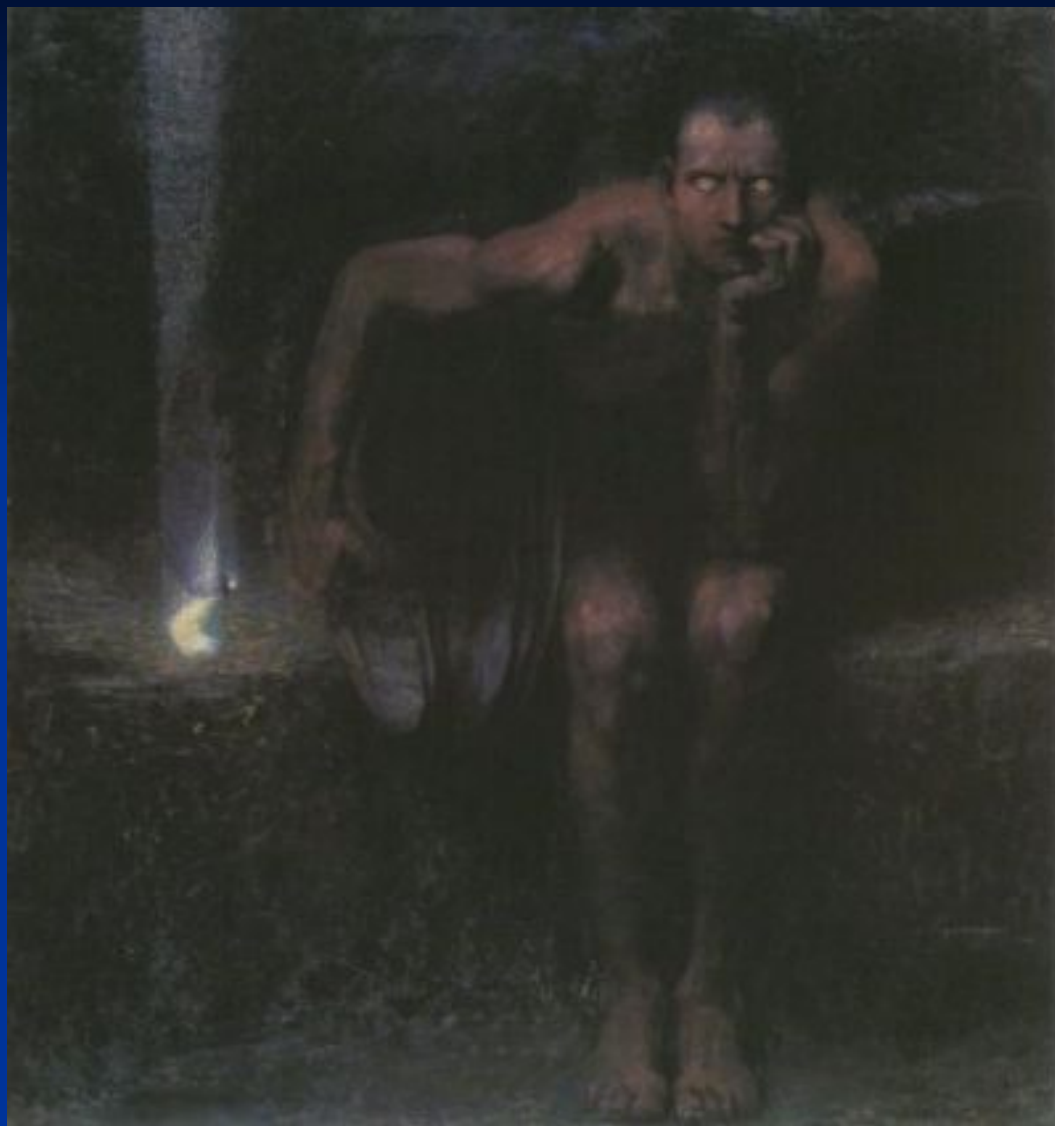
Ф. фон Штук. «Люцифер».