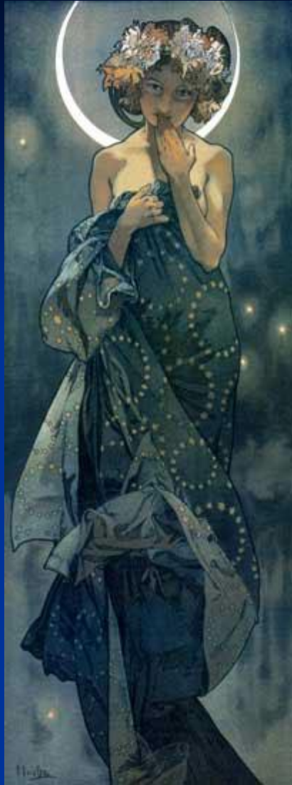
А. Муха. Из серии «Звёзды». «Лунное сияние».