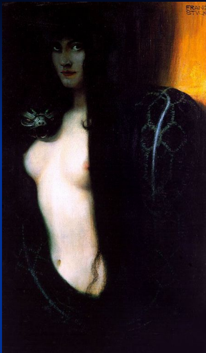
Ф. фон Штук. «Грех».