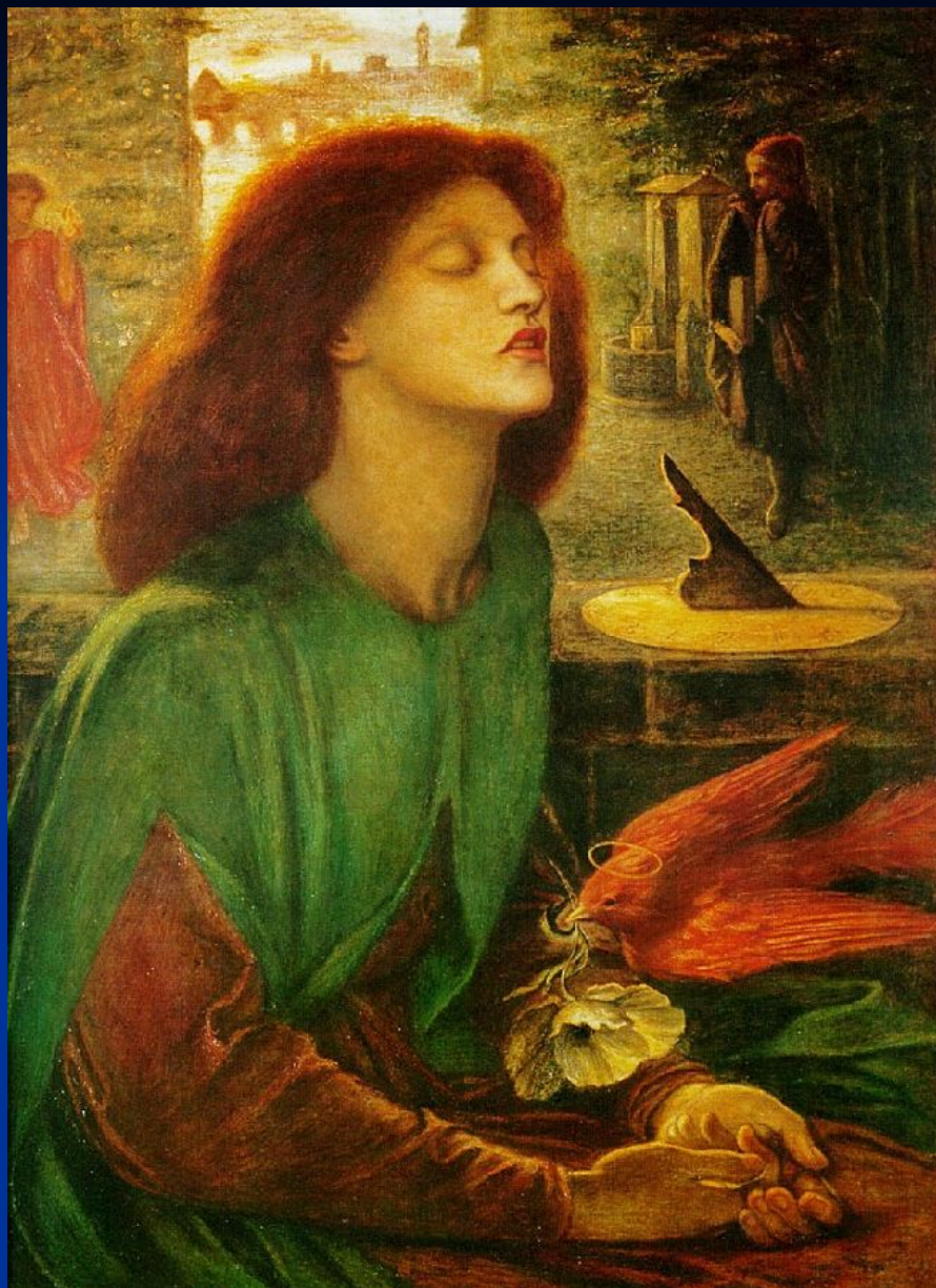
Д. Г. Россетти. «Благословенная Беата».