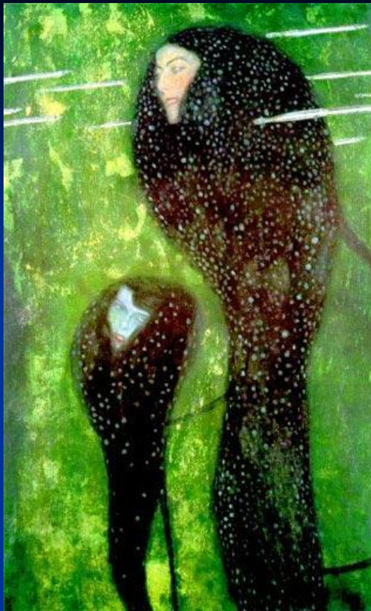
Г. Климт. «Русалки».