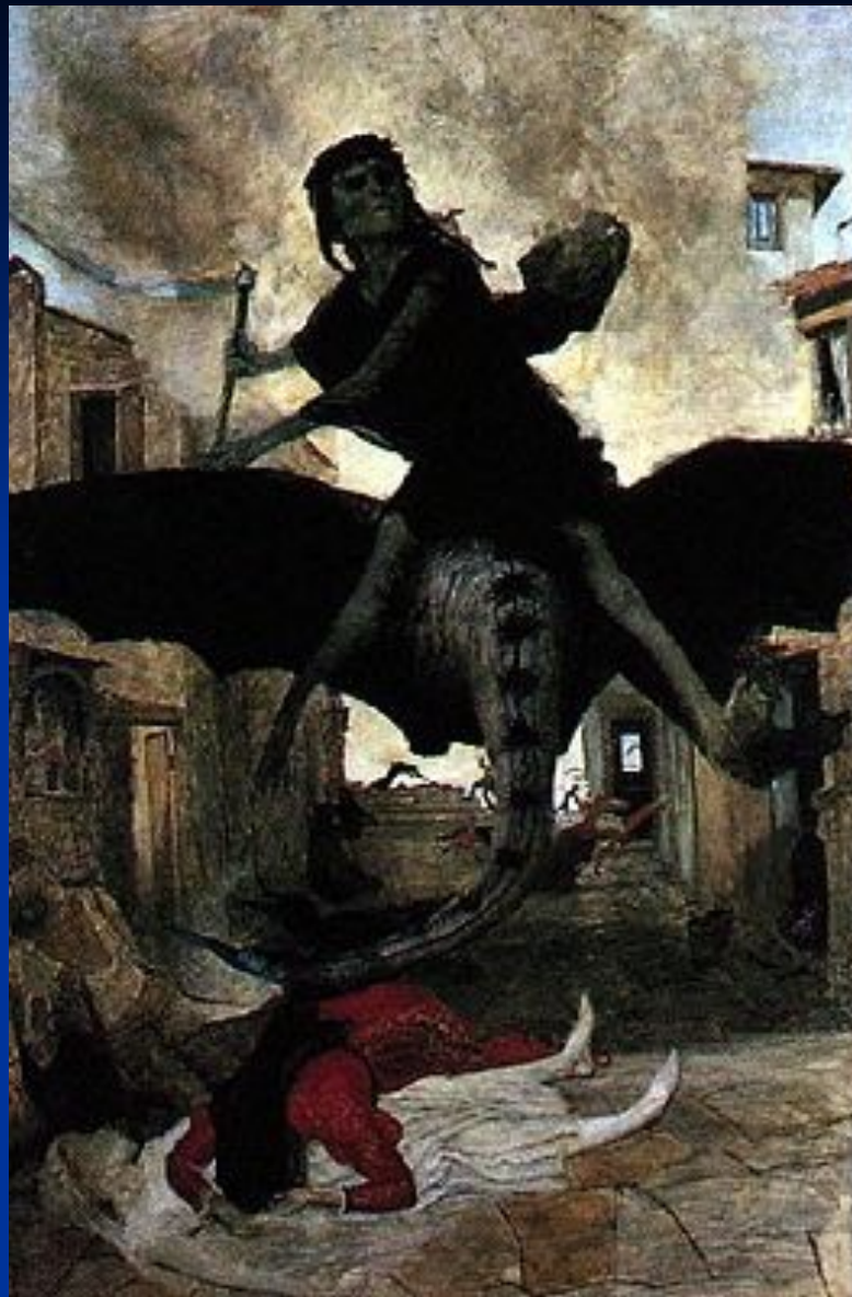
А. Бёклин. «Чума».