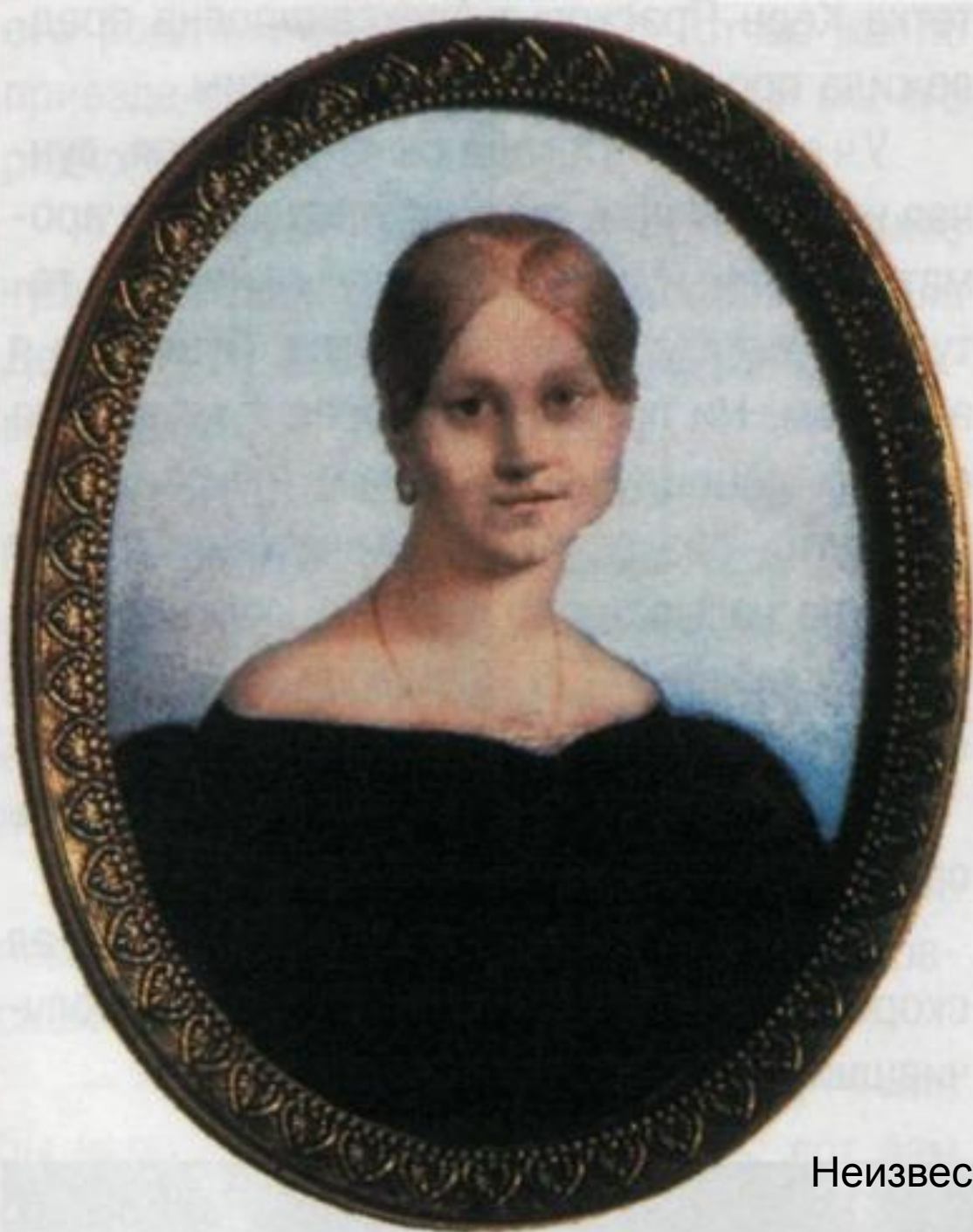
А. П. Керн. Неизвестный художник. 1820-е годы