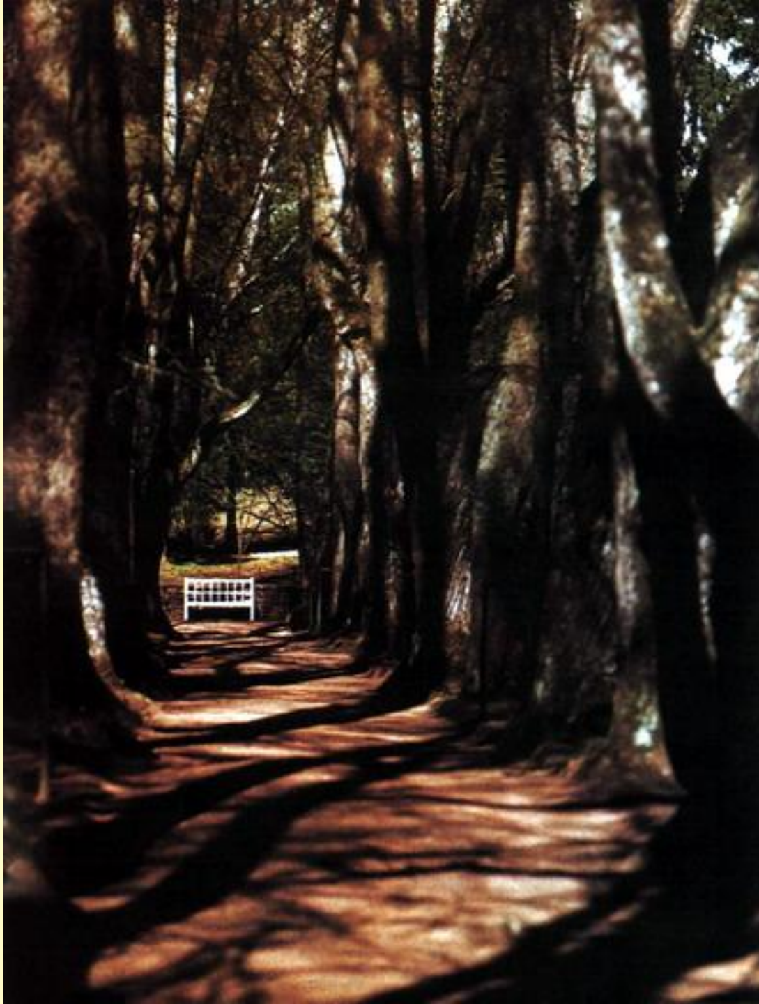
Аллея Анны Керн в Михайловском парке