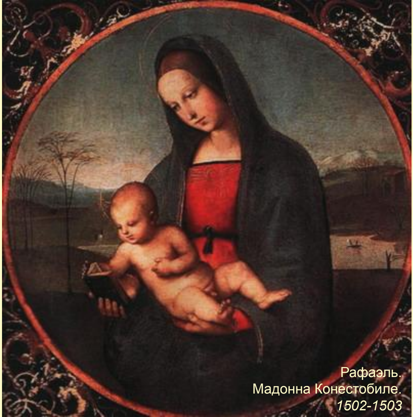
Рафаэль. Мадонна Конестобиле. 1502-1503