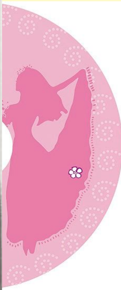
Ф.И.Иордан. А.И.Истомина. 1825