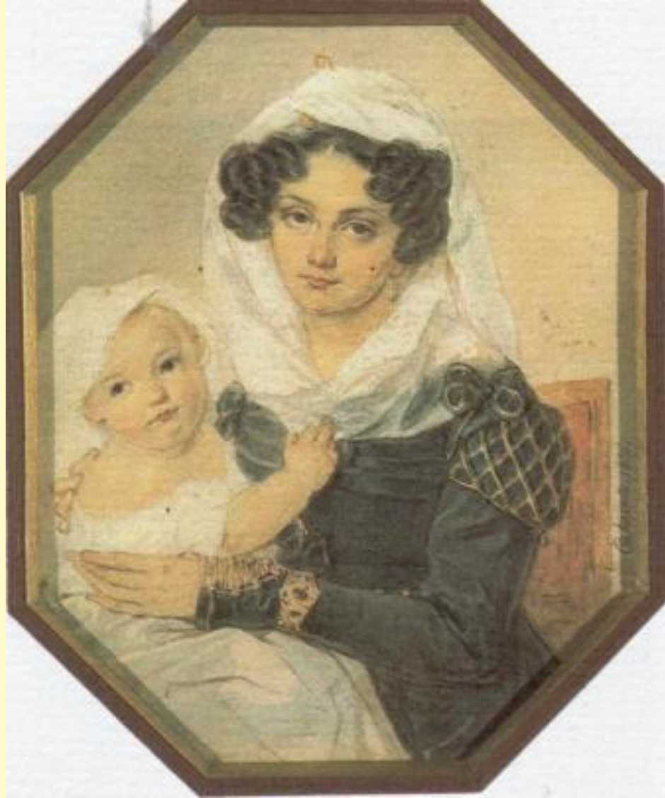
Соколов М.Н. М.Н.Волконская с сыном. 1826