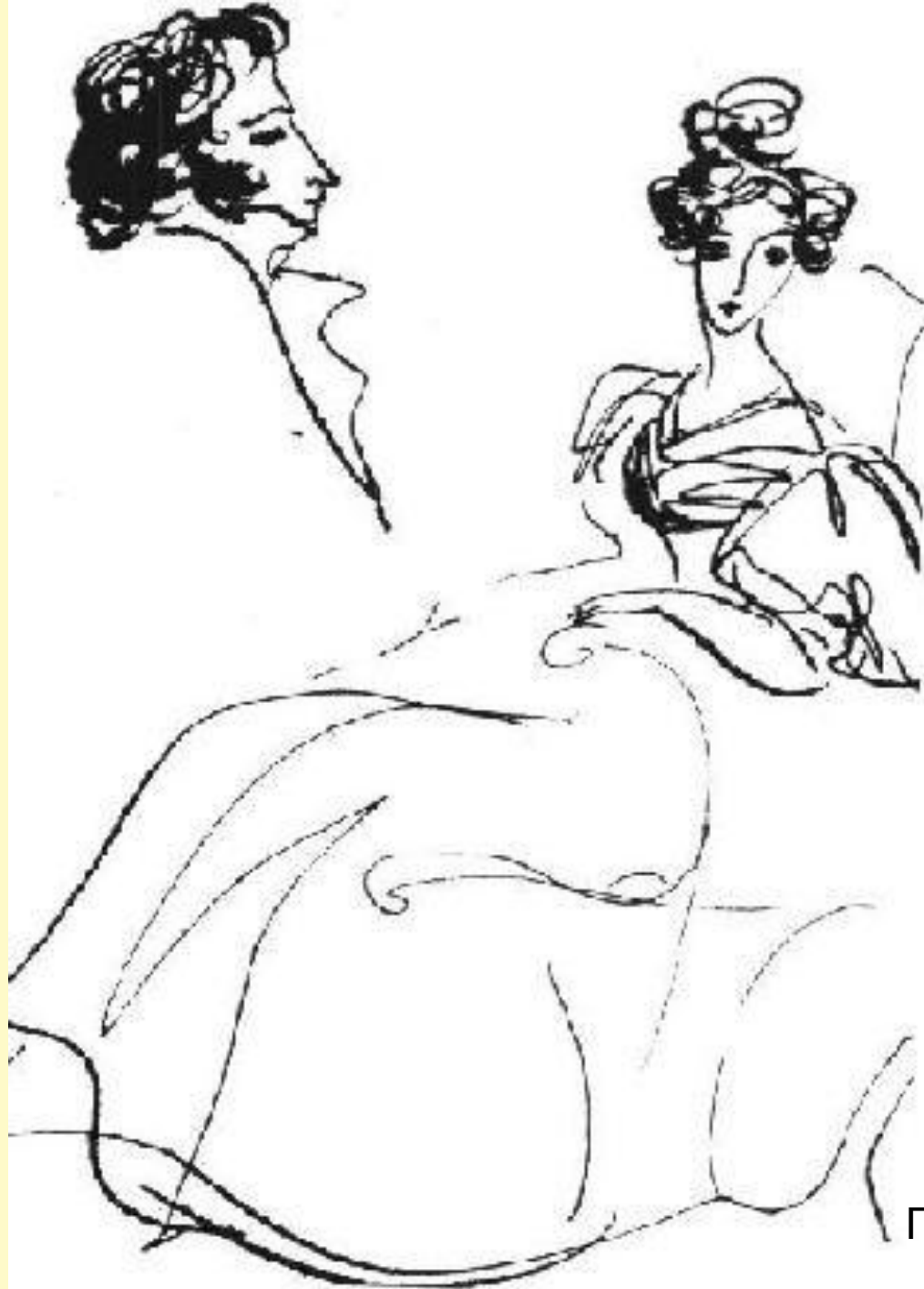
Н. Рушева. Пушкин и Анна Керн. 1968