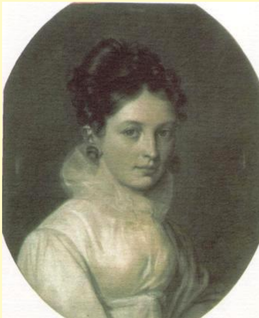
Бакунина Е.П. Автопортрет. 1816