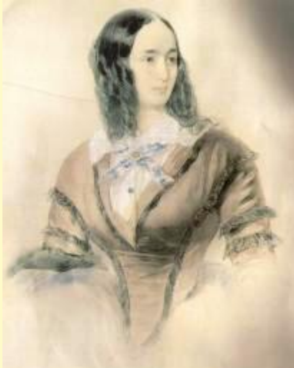
В.Гау. 1842 Наталья Николаевна Пушкина.