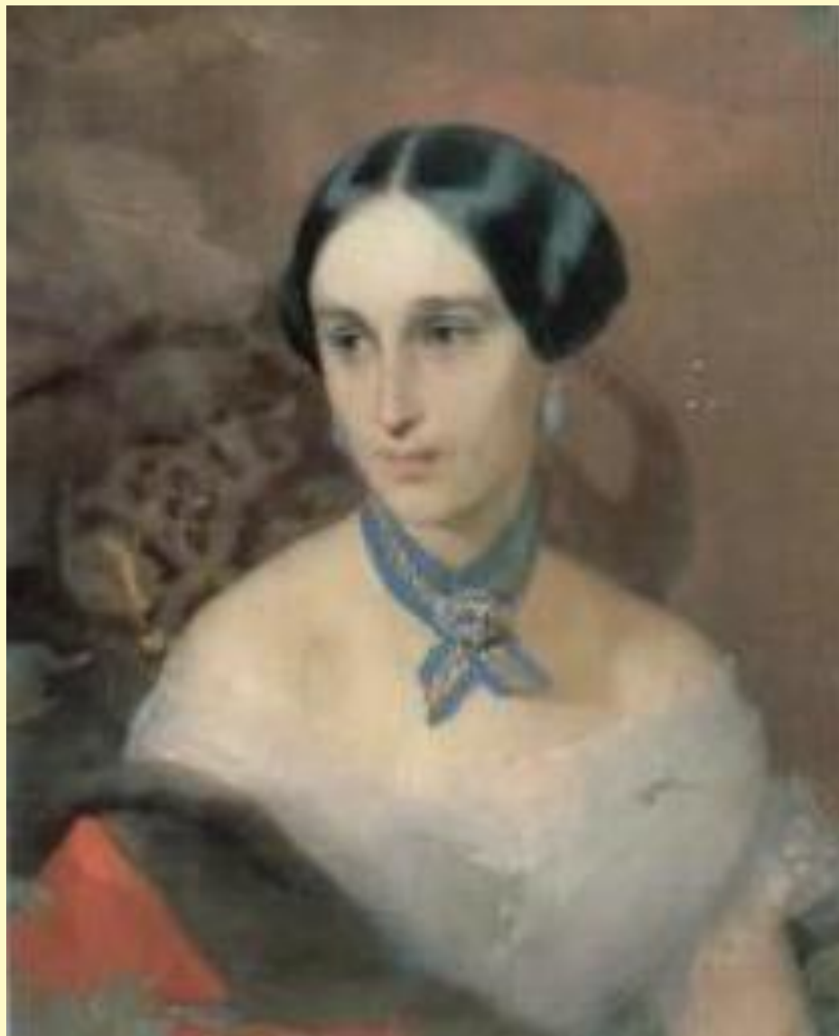
И.К.Макаров. 1849. Наталья Николаевна Ланская