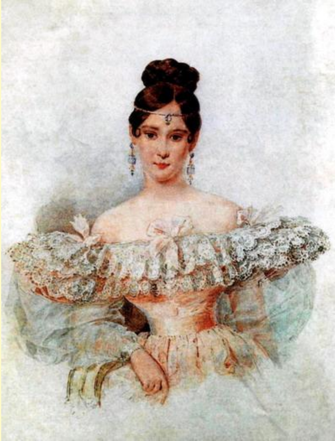
А.П.Брюллов. Портрет Н.Н.Гончаровой. 1831-1832