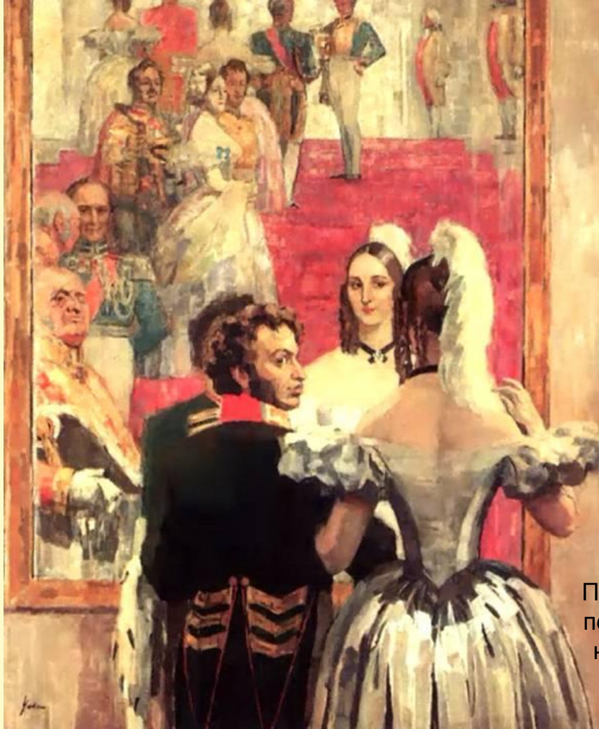
Н. Ульянов. Пушкин с женой перед зеркалом на придворном балу. 1936