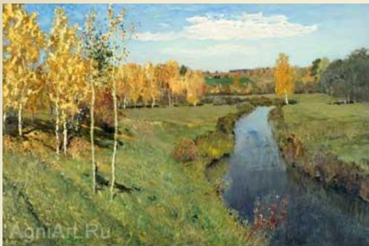
И. И. Левитан «Золотая осень»