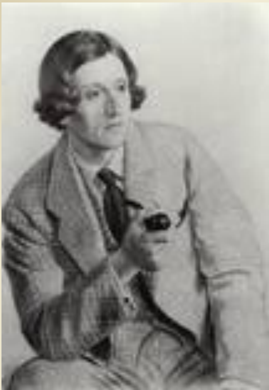
Исаак Израелевич Бродский