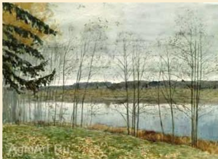
И. И. Левитан «Осень»