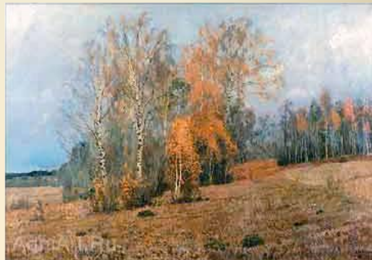
И. И. Левитан «Октябрь»