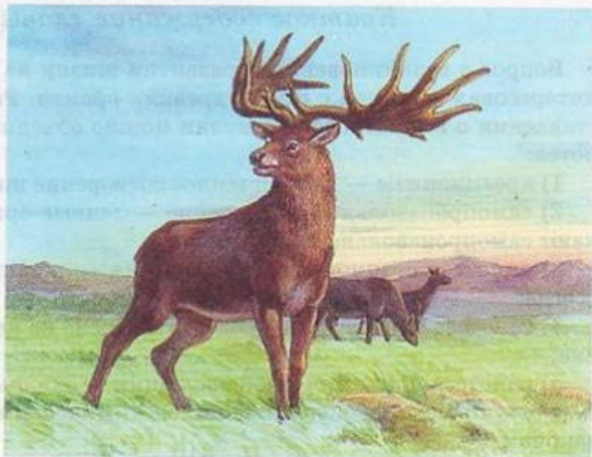
Рис. 103. Большерогий олень

Сумчатые и плацентарные млекопитающие развивались параллельно. От каких-то групп плацентарных насекомоядных произошли хищники и примитивные копытные.