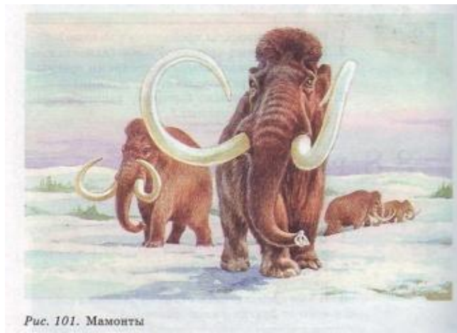
Рис. 101. Мамонты

время расцвета покрытосеменных растений, насекомых и высших позвоночных животных: птиц и млекопитающих