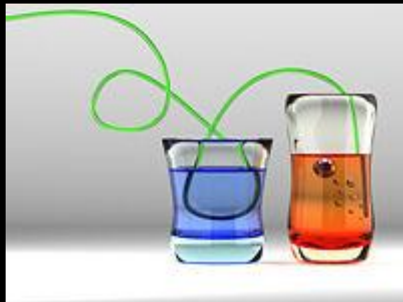
Преломление света в разных жидкостях и стекле