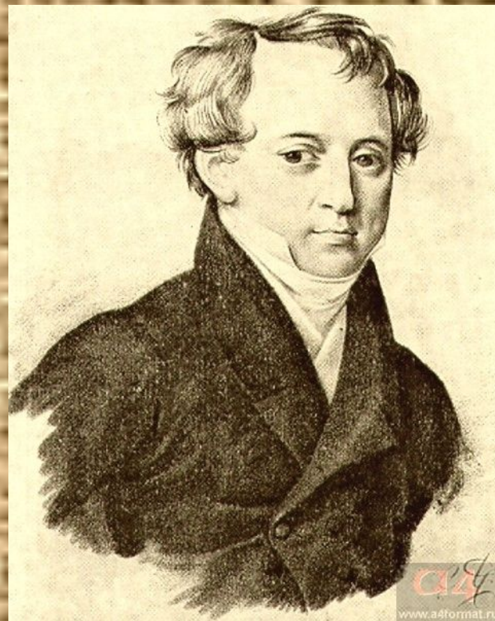
Ф.И. Тютчев. Неизвестный художник. 1825