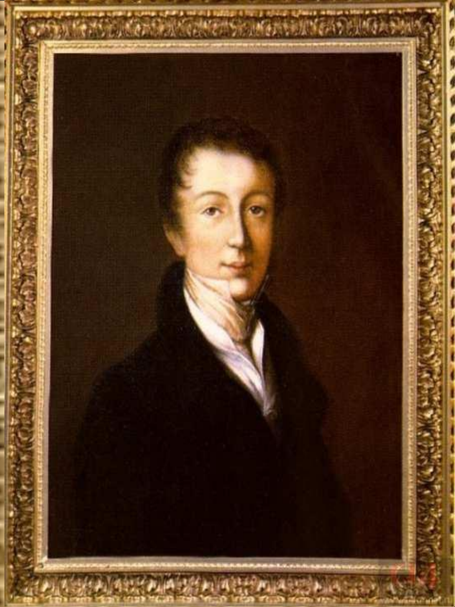
Ф.И. Тютчев. Неизвестный художник. 1819–1820