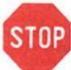
2.5 Движение без остановки запрещено