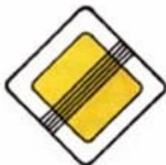
2.2 Конец главной дороги