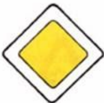
2.1 Главная дорога