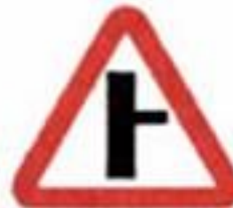
2.3.2 Примыкание второстепенной дороги