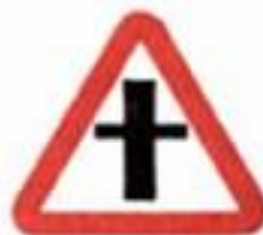
2.3.1 Пересечение со второстепенной дорогой