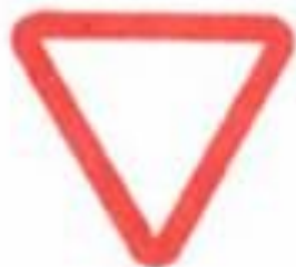
2.4 Уступите дорогу