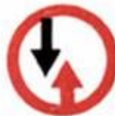
2.6 Преимущество встречного движения