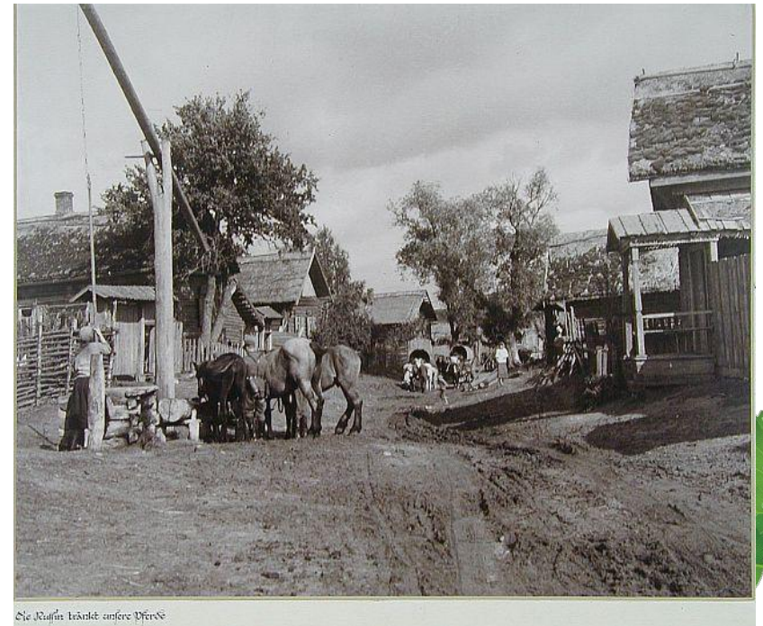
Не Раффинс, вкратце, сфотографировано