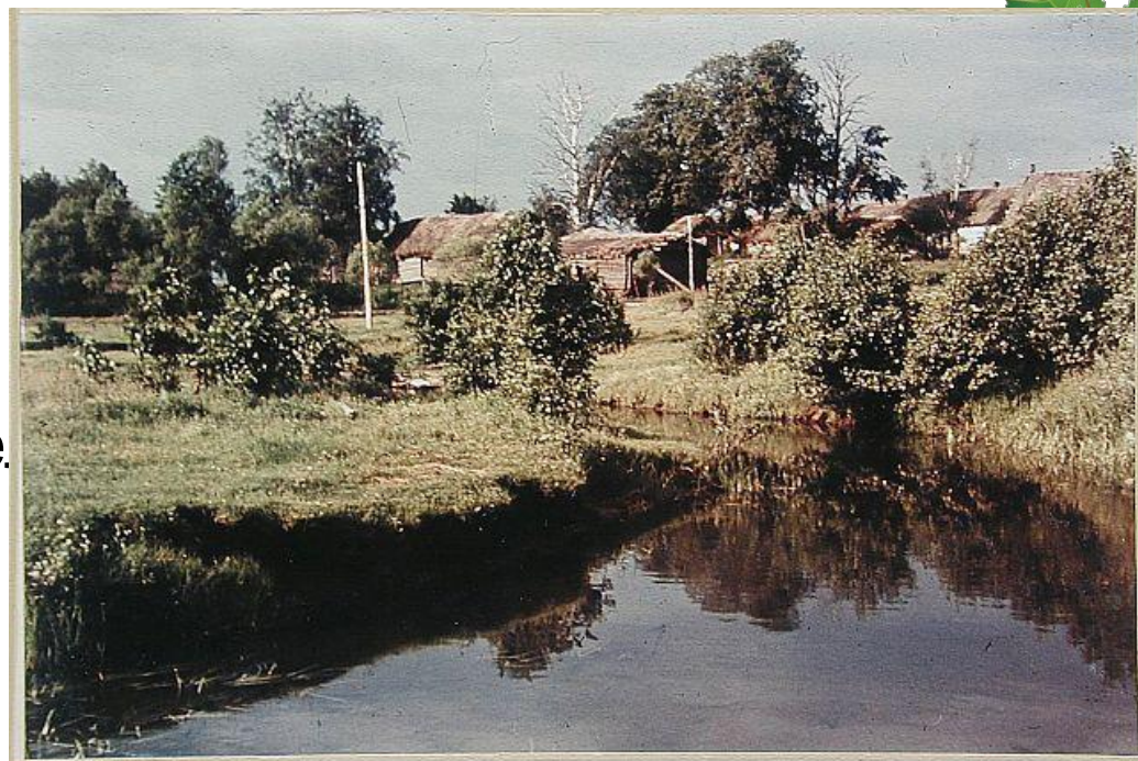
An Ser Bolwa