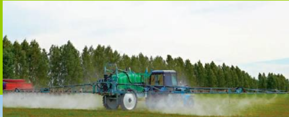
Применение удобрений и ядохимикатов