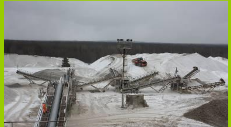
Разработка полезных ископаемых