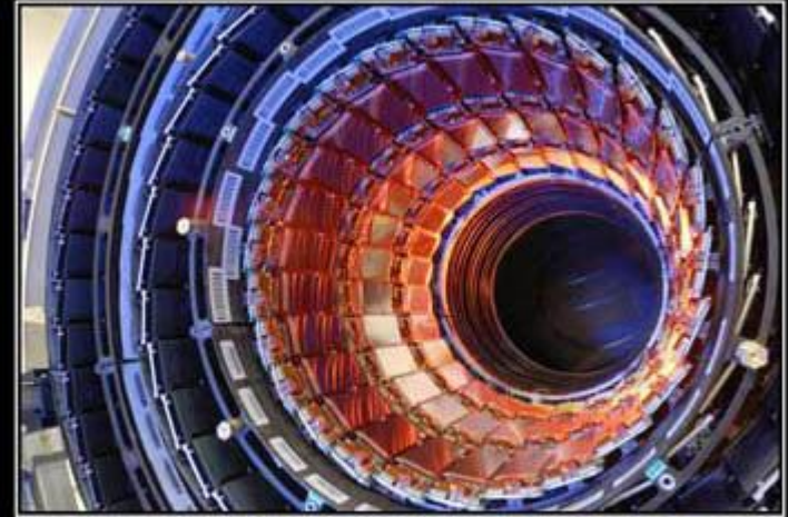
LARGE HADRON COLLIDER

Большой адронный коллайдер на встречных пучках, предназначенный для разгона протонов и тяжёлых ионов и изучения продуктов их соударений. Коллайдер построен в научно-исследовательском центре Европейского совета ядерных исследований, на границе Швейцарии и Франции, недалеко от Женевы. По состоянию на 2008 год БАК является самой крупной экспериментальной установкой в мире. Большим БАК назван из-за своих размеров: длина основного кольца ускорителя составляет 26 659 адронным — из-за того, что он ускоряет адроны, то есть частицы, состоящие из кварков; коллайдером — из-за того, что пучки частиц ускоряются в противоположных направлениях и сталкиваются в специальных местах