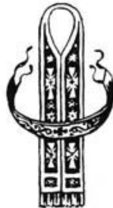
Епитрахиль и пояс

На руки священник надевает специальные поручи - узкие нарукавники, стягивающиеся шнурками. Символически они отождествляются с веревками на руках Иисуса Христа.