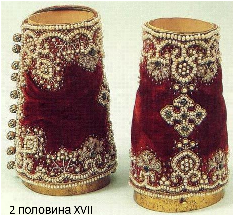
2 половина XVII века

Поверх епитрахили и подризника священники надевают специальный пояс , имеющий несколько символических значений, в том числе напоминание о полотенце, которым препоясался Иисус Христос, когда омывал ноги своим ученикам.