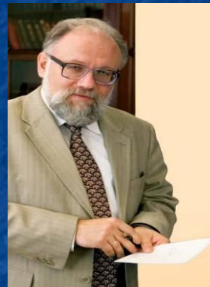
Чуров В.Е. председатель ЦИК