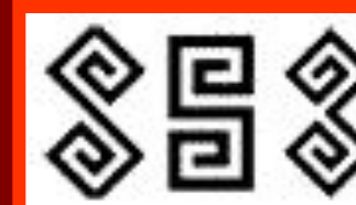
память о прошлом