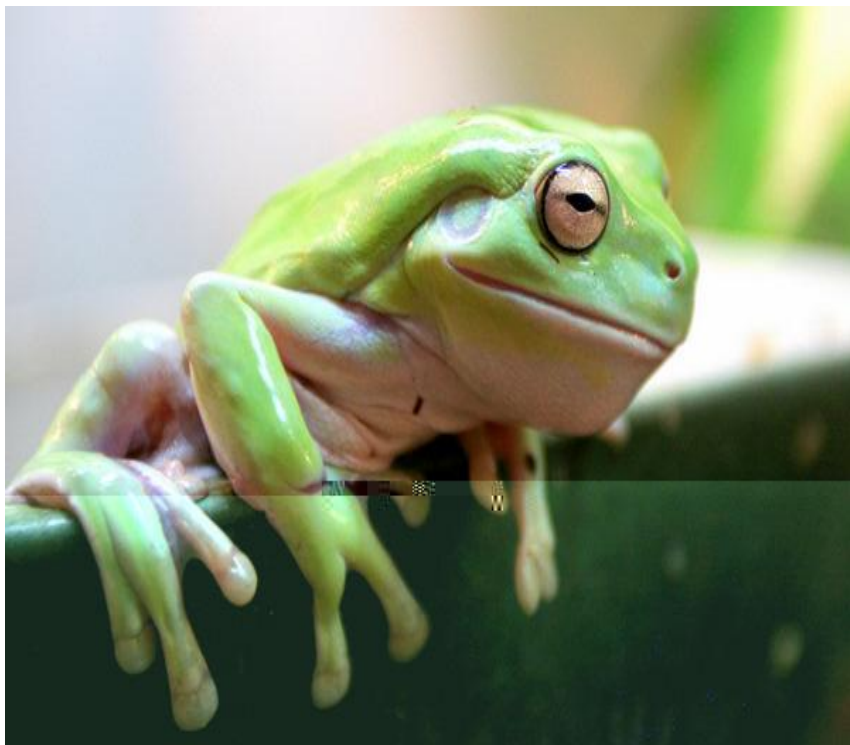
Австралийская голубая квакша

Австралия славится великим изобилием амфибий, особенно лягушек. 93% из 5280 видов лягушек – эндемики. Из них следует отметить семейство австралийских жаб, род австралийских квакш и др.