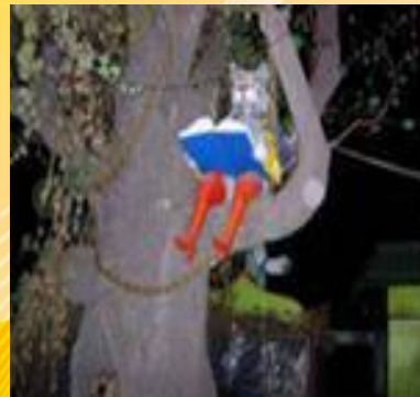
Кот ученый. Ростов-на-Дону.