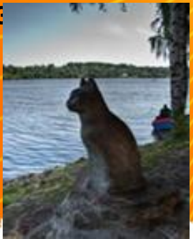
Памятник кошке Мухе в Плесе, поставленный рыбаками