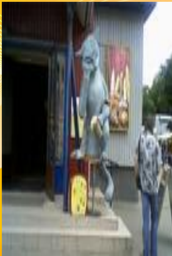
Вход в кафе «Ешкин кот»