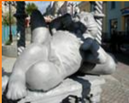
Памятник коту каз