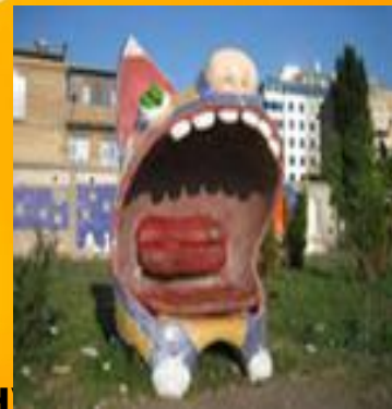
Памятник мартовскому коту в Киеве