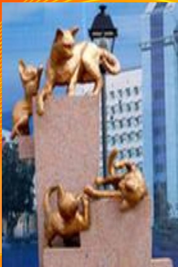
Памятник подопытной кошке в Красноярске