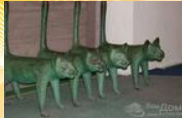
Памятник корабельному коту. Юрмала.