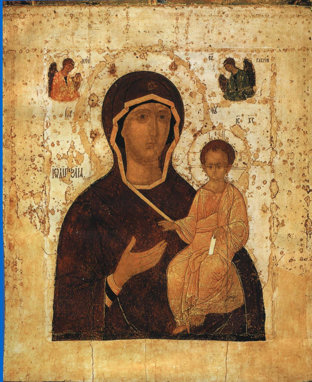
Дионисий и мастерская. Богоматерь «Одигитрия». Ок. 1502-1503.