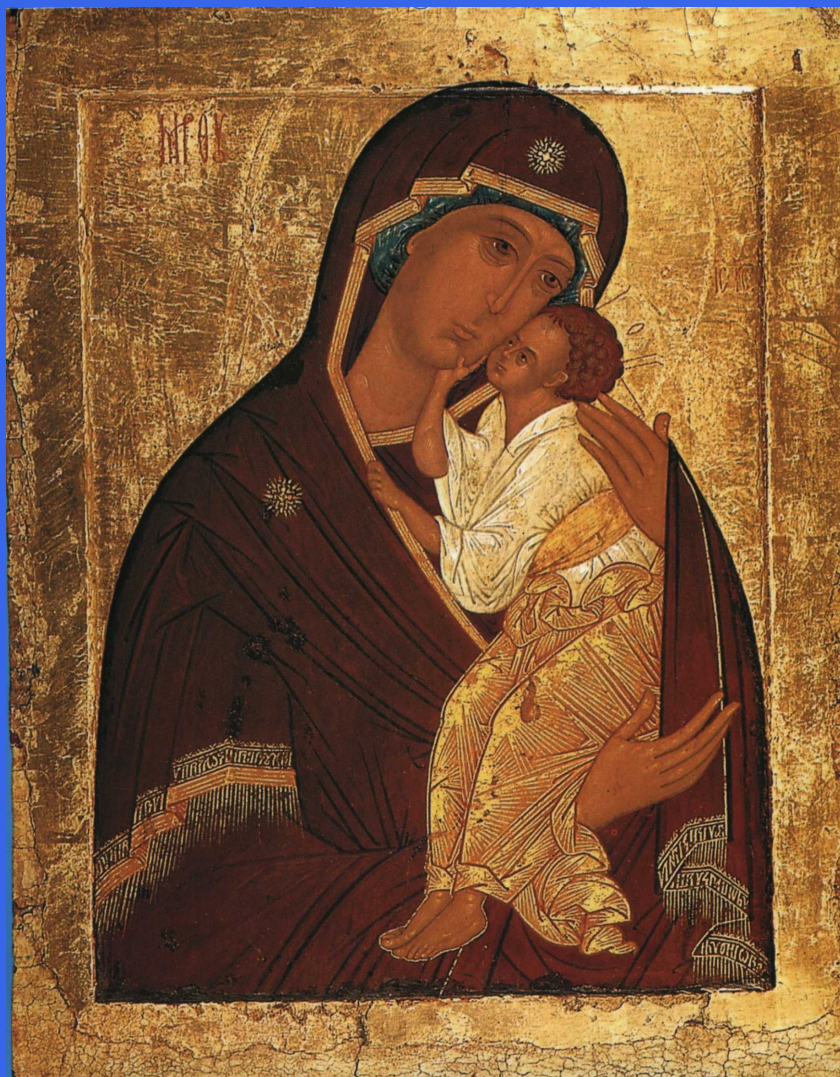
Богоматерь Ярославская. Вторая половина XV века.