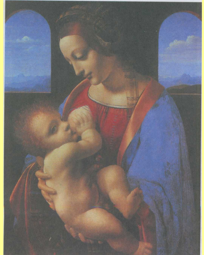
«Мадонна Бенуа» Леонардо да Винчи