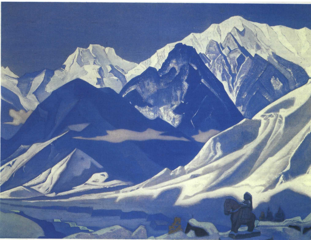
Н. Рерих. Кулута.