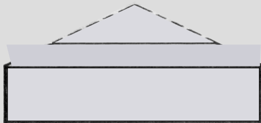
Изображение предмета в прямой перспективе