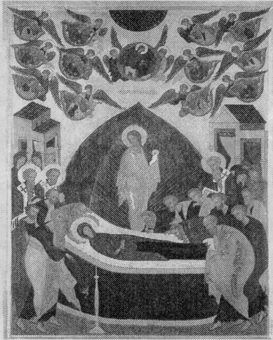
Икона «Успение Божией Матери»