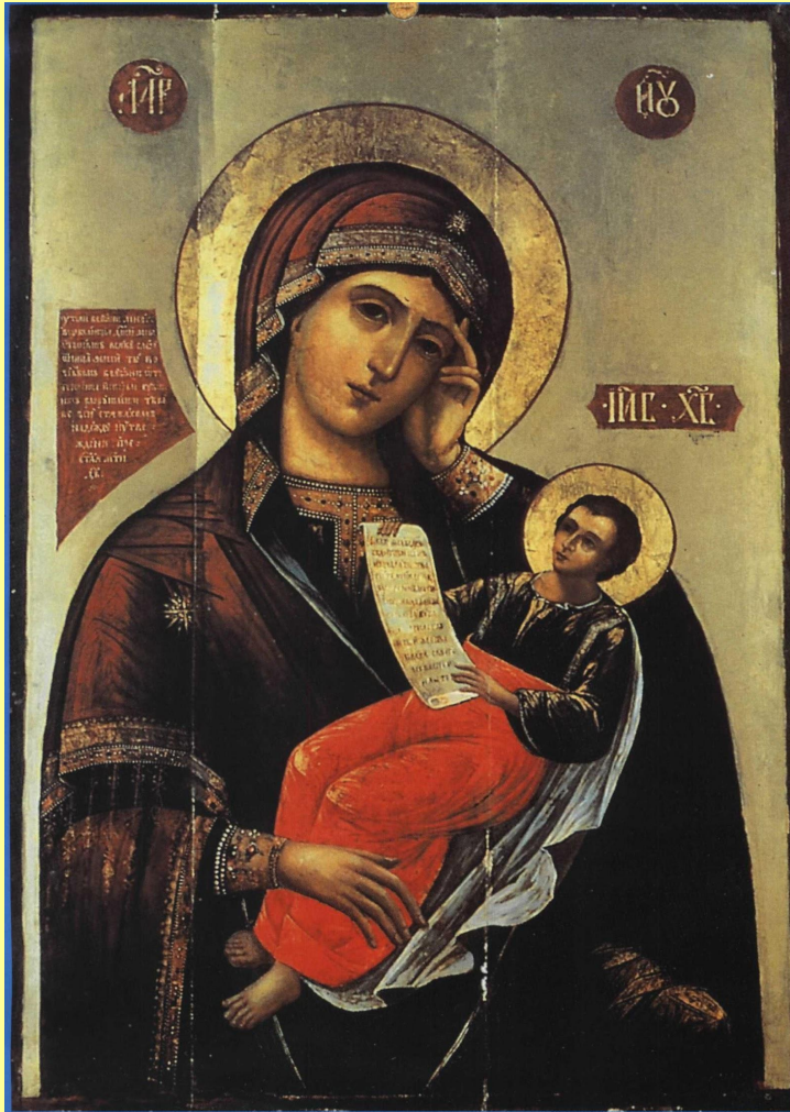
Икона Пресвятой Богородицы «Утоли моя печали»