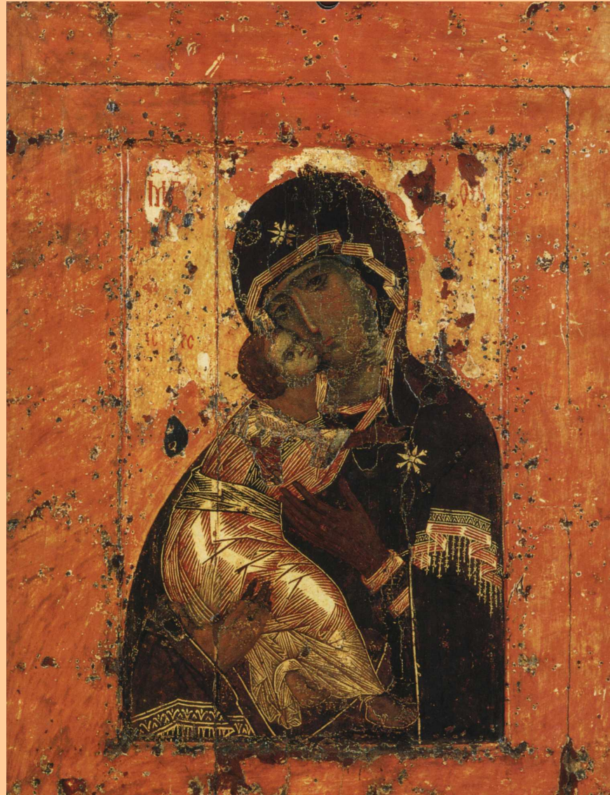
Икона Божией Матери Владимирская. Первая треть XII века.