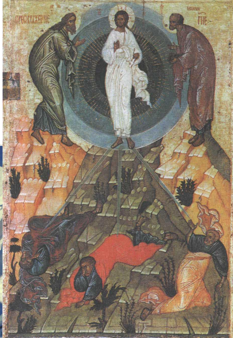
Преображение. Икона. Конец XV в.