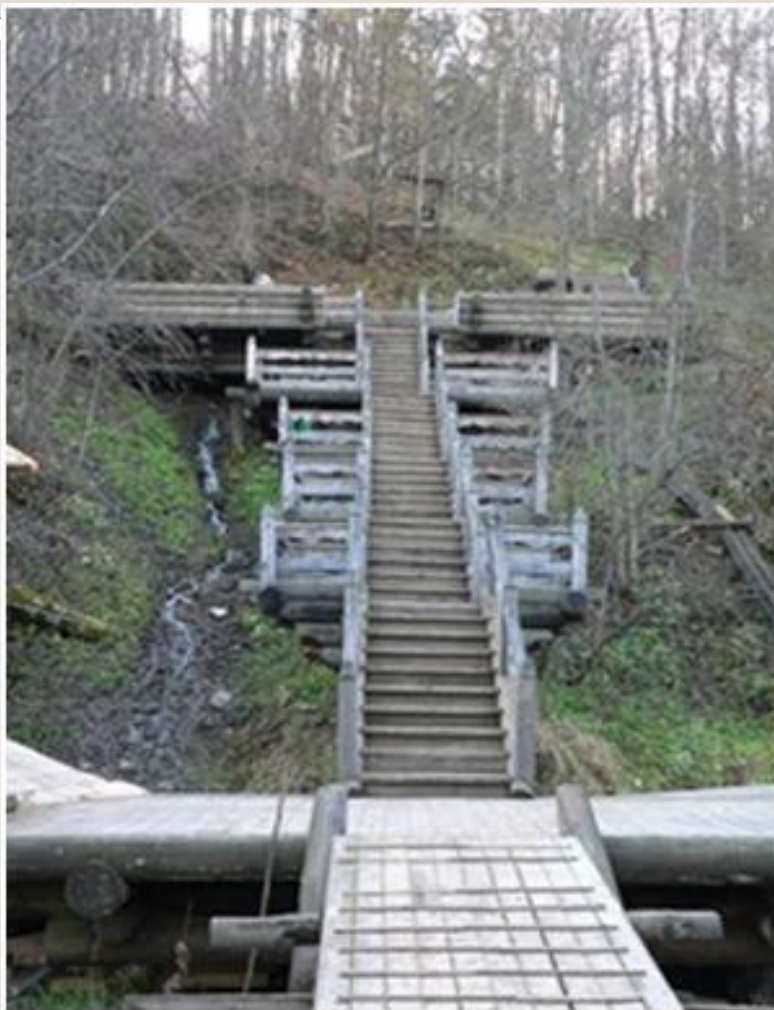
Гремячий ключ. Лестница к водопаду