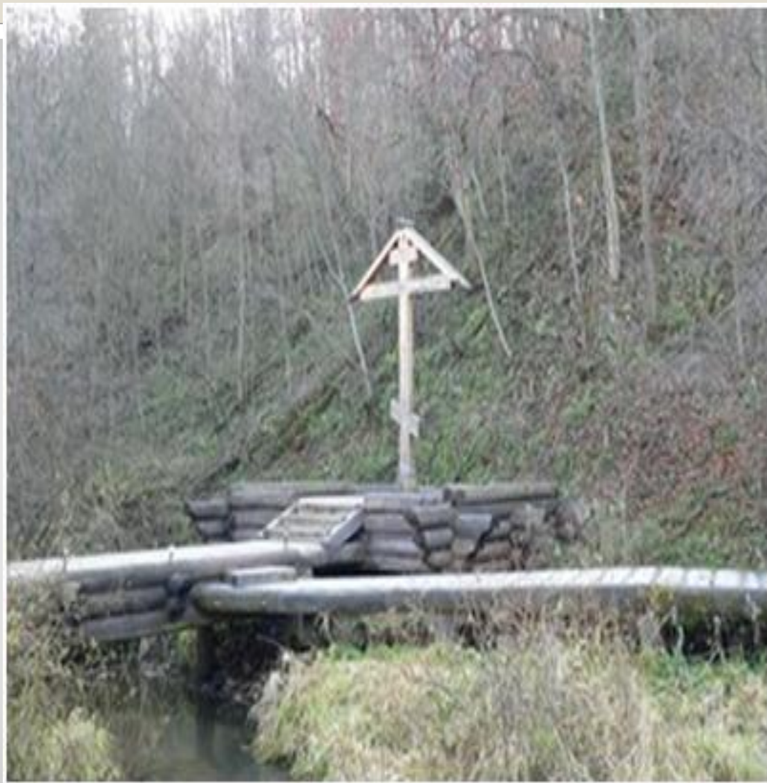
Крест над источником