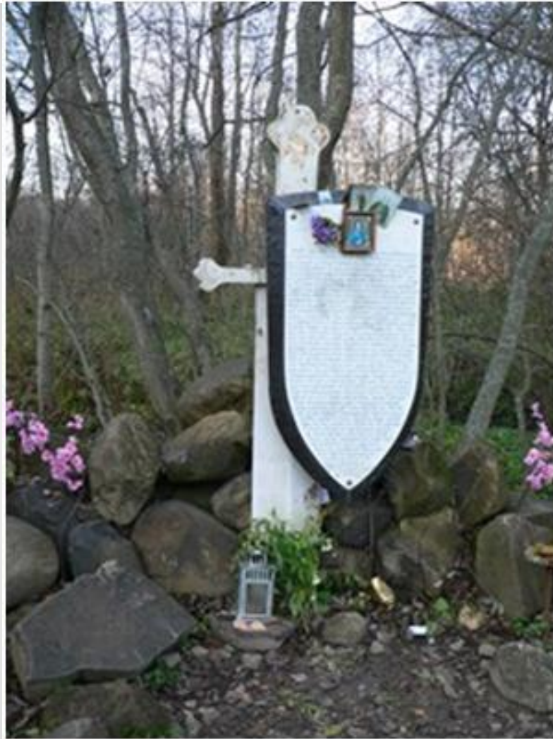
Памятный знак у источника