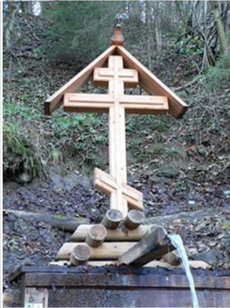
Крест над святым источником