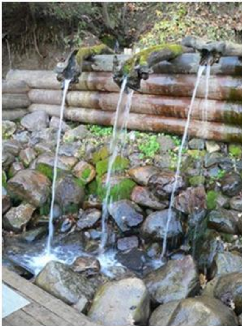
Святой источник преподобного Сергия Радонежского