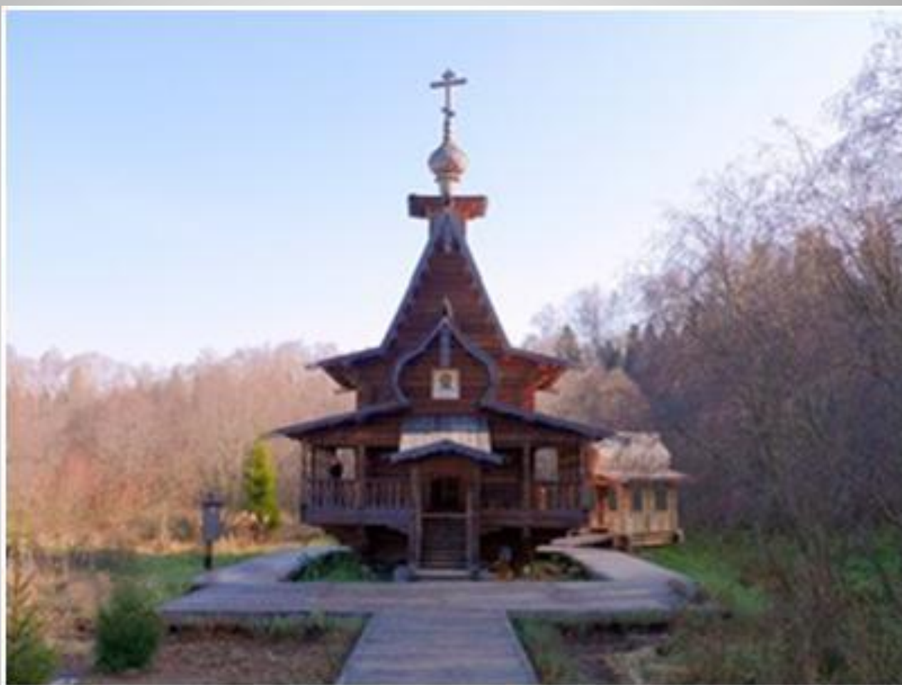
Часовня Сергия Радонежского у Взгляднево