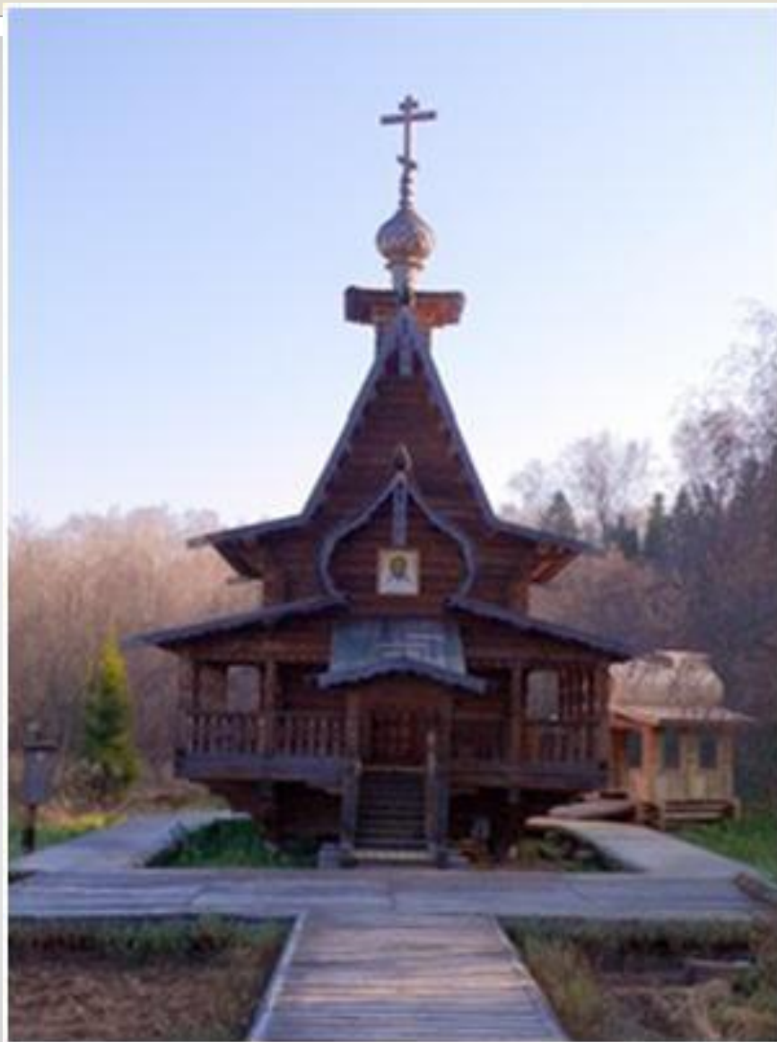
Часовня Сергия Радонежского у водопада Гремячий