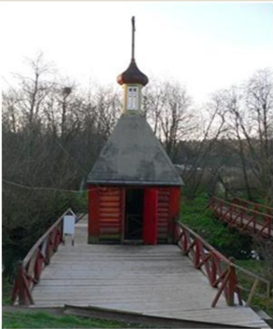
Деревянная купальня рядом с источником