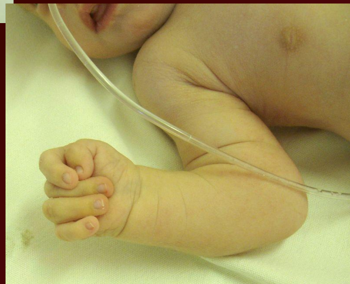
Рис 13, 14, 15 – синдром Эдварса