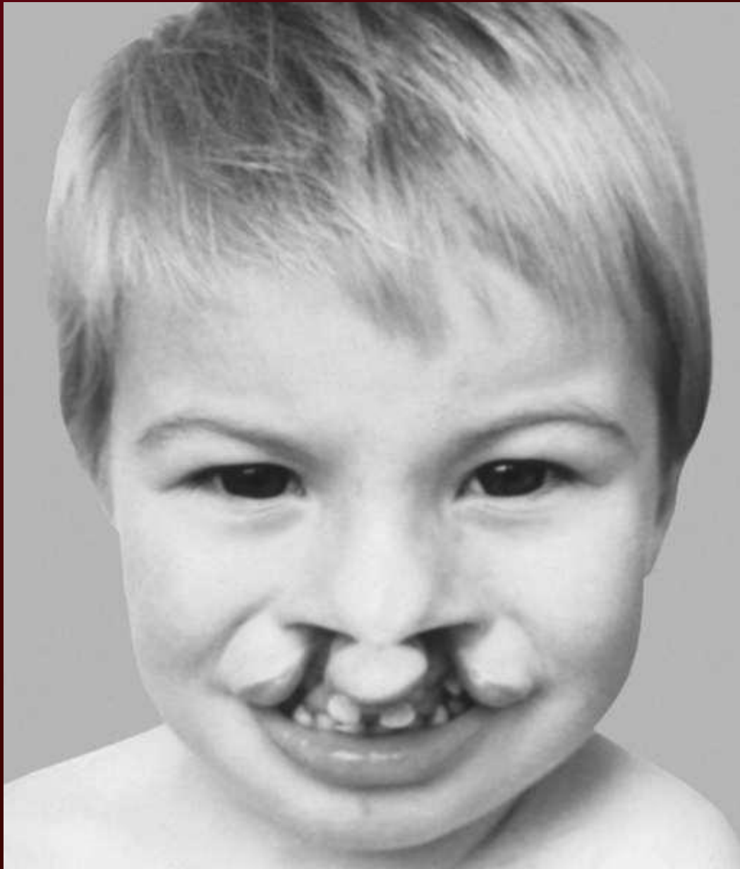
Рис 16 – синдром Эдварса