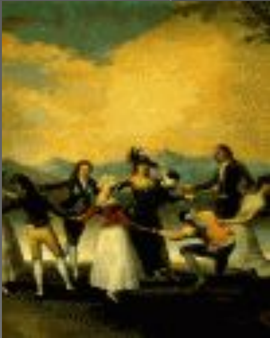
Игра в жмурки