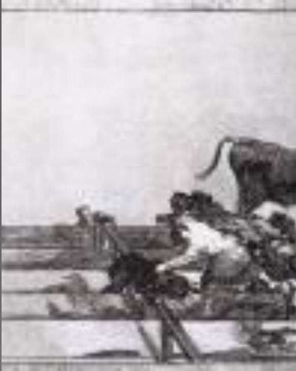
Несчастный случай во время корриды в Мадриде