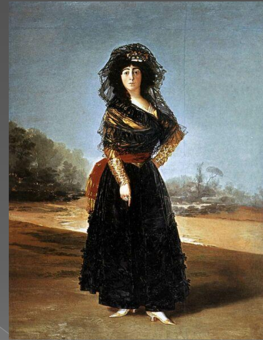
Герцогиня Альба в черном

Кольца на руках герцогини (традиционный символ любовной связи) подписаны именами «Альба» и «Гойя».