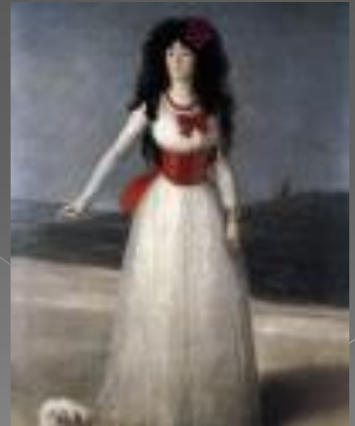
Герцогиня Альба в белом