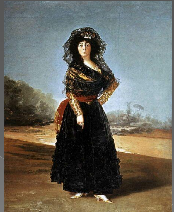
Герцгиня Альба в черном