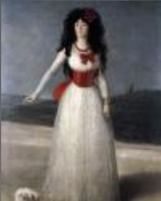
Герцогиня Альба в белом