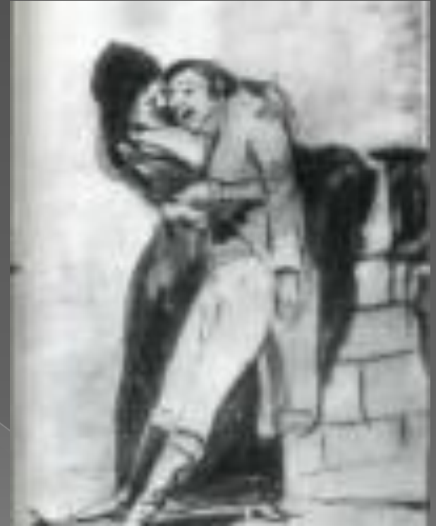
Любовь и смерть