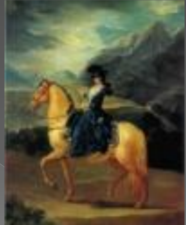
Портрет Мари - Терезы де Валлабриджа