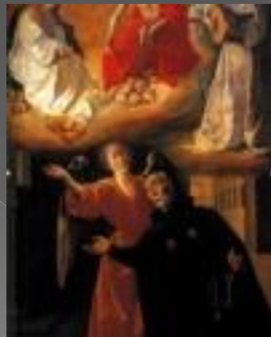
Видение святого альфонса Родригеза