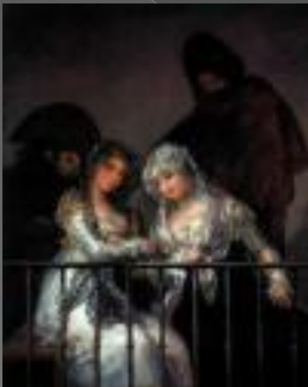
Махи на балконе