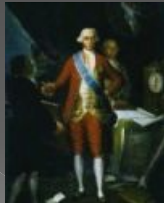
Портрет графа Флоридабланка