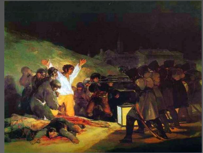
Расстрел повстанцев в ночь на 3 мая, 1808 г.