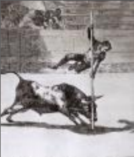
Ловкость Хуанито Апинани на арене Мадрида