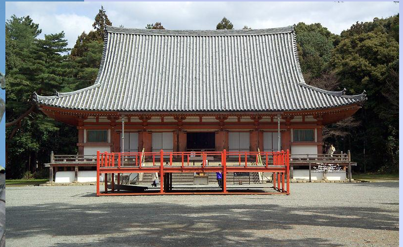
Храм Дайго-дзи в Киото