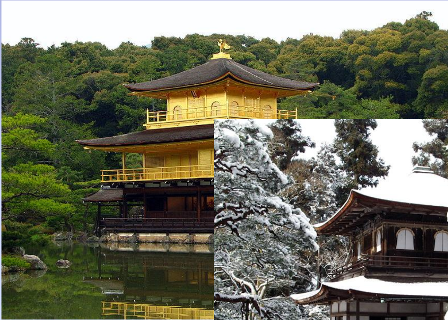
Кинкаку-дзи (Золотой павильон) Киото