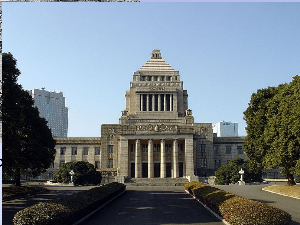
Здание Парламента Японии