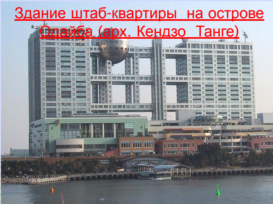
Здание штаб-квартиры на острове Одайба (арх. Кендзо Танге)