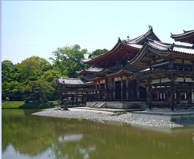
Храм Феникса (храм Хоодо) в монастыре Бёдо-ин