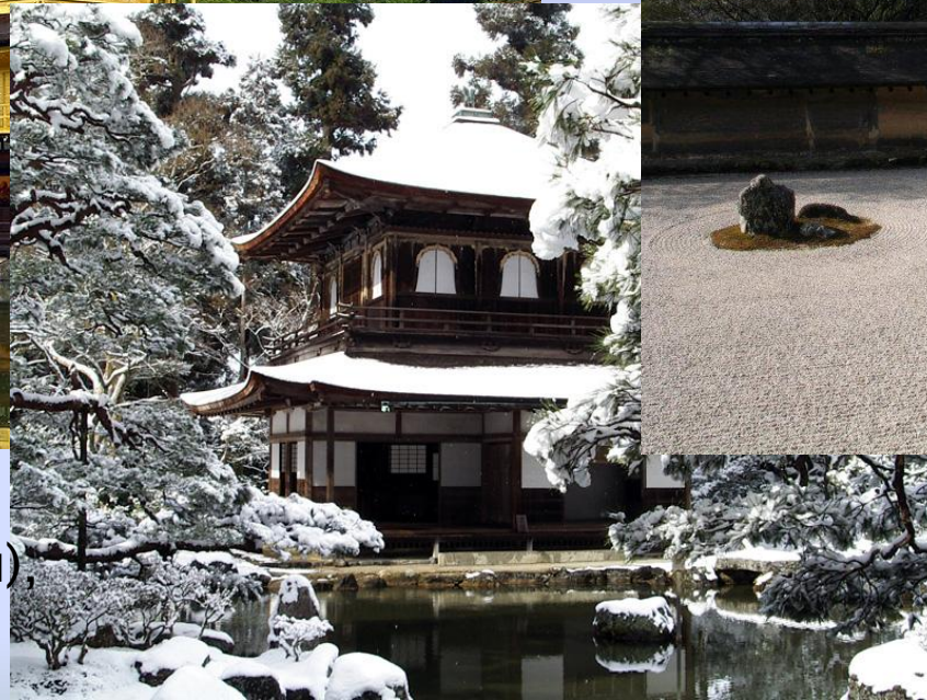
Гинкаку-дзи (Серебряный павильон)