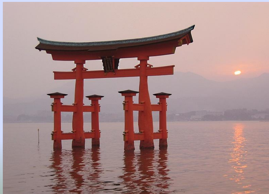
Тории святилища Ицукусима