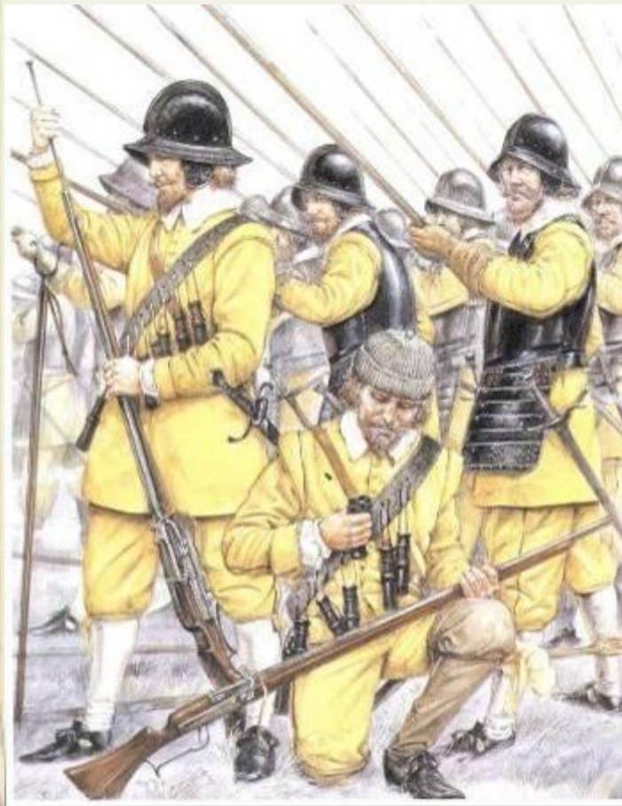
Солдаты «Желтой» бригады одного из основных подразделений шведов в битве при Лютцене 1632 год.