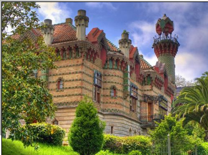
дом Эль Капричо