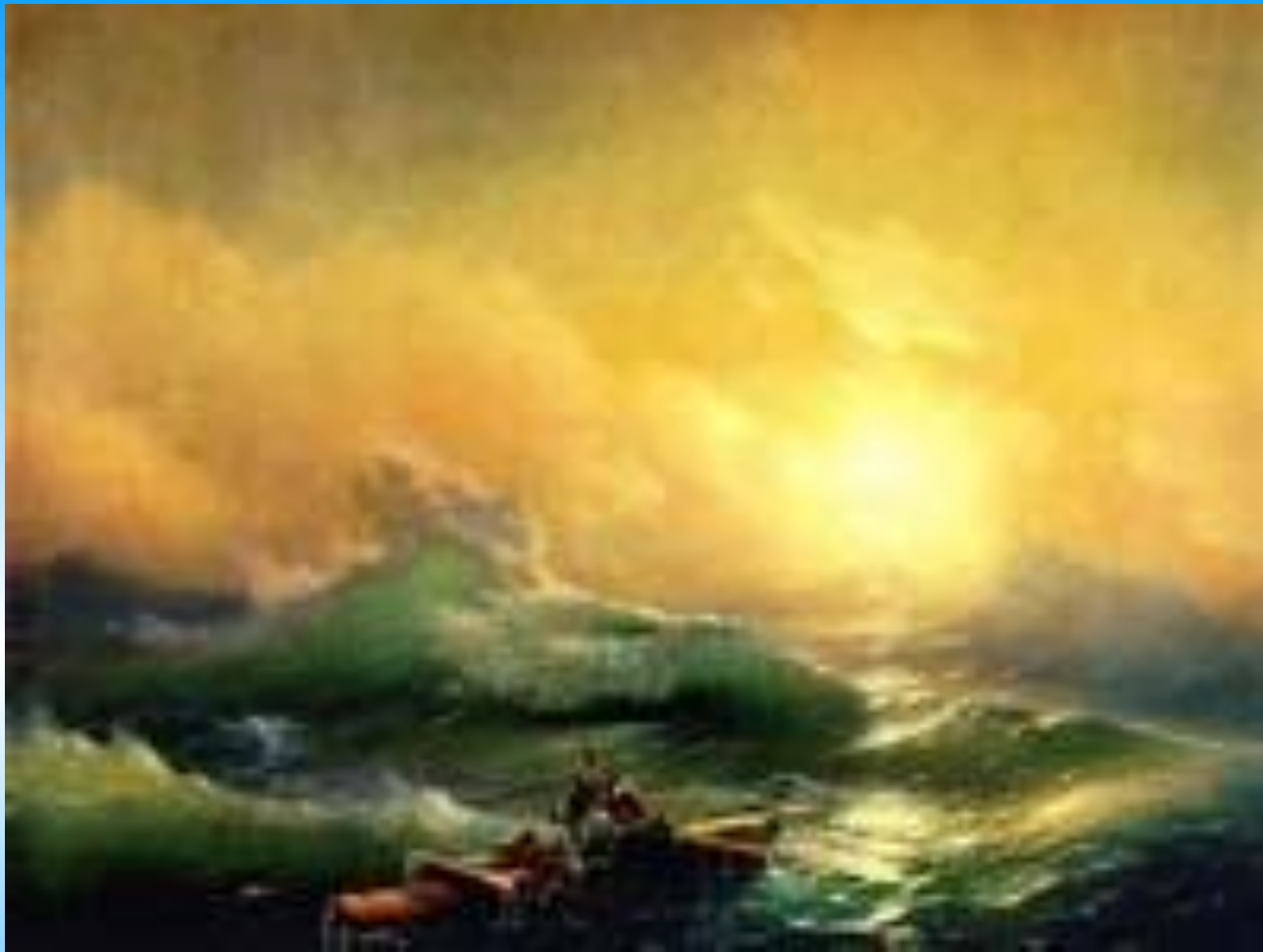
Айвазовский. Девятый вал 1850

Юный Айвазовский любил играть на скрипке, петь и рисовать самоварным углем на стенах домов, а еще он испытывал просто необыкновенную страсть к морю с рождения и до конца своих дней.