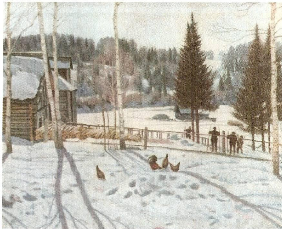
К. Юон «Конец зимы. Полдень»

Ульченко З. Ф. Диктанты с изменением текста. М.: Просвещение, 1982.