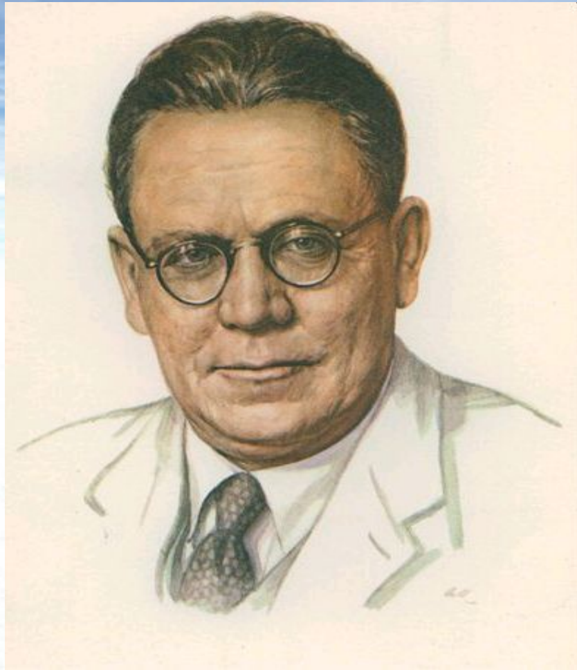
Портрет С.Я. Маршака работы А.Г. Кручины