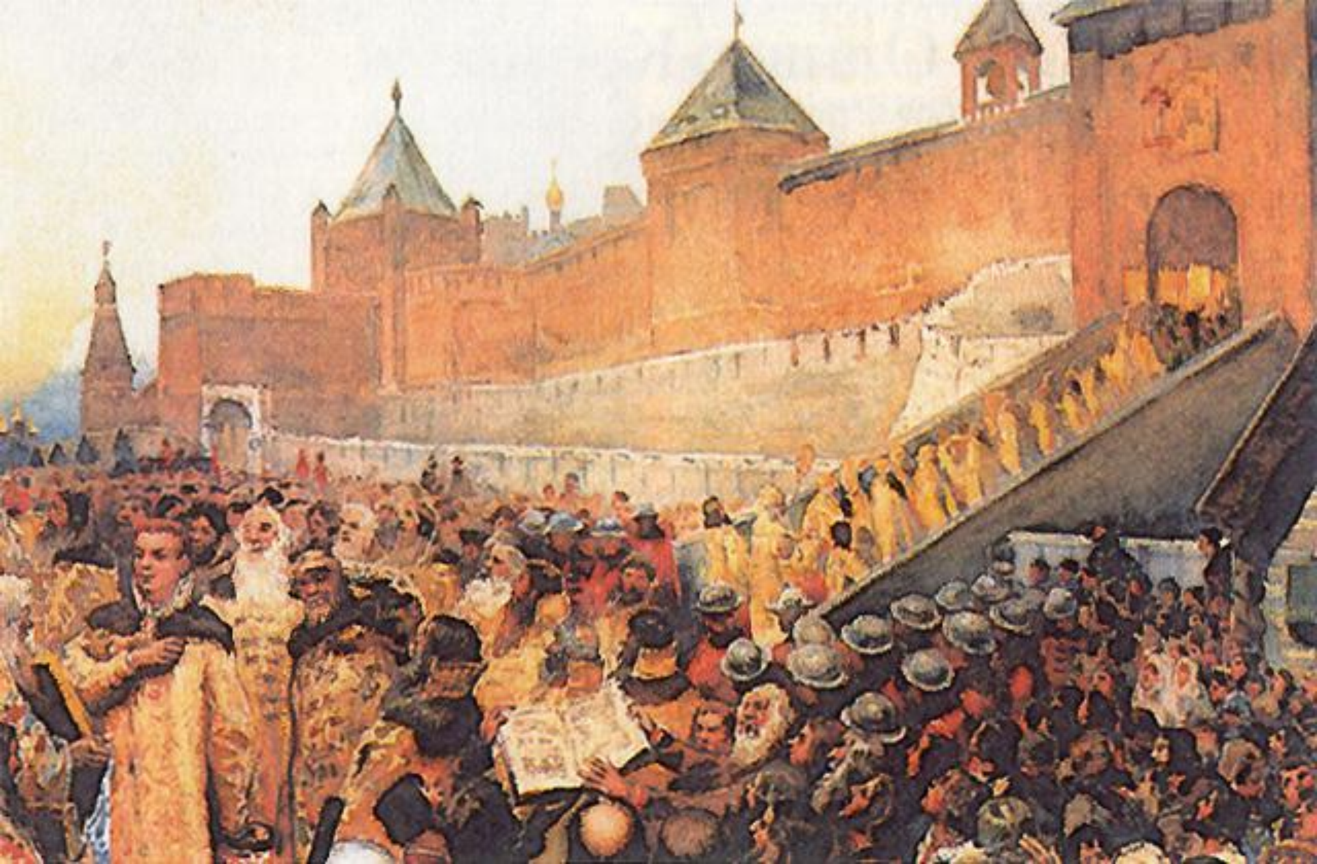
Въезд Лжедмитрия I в Москву