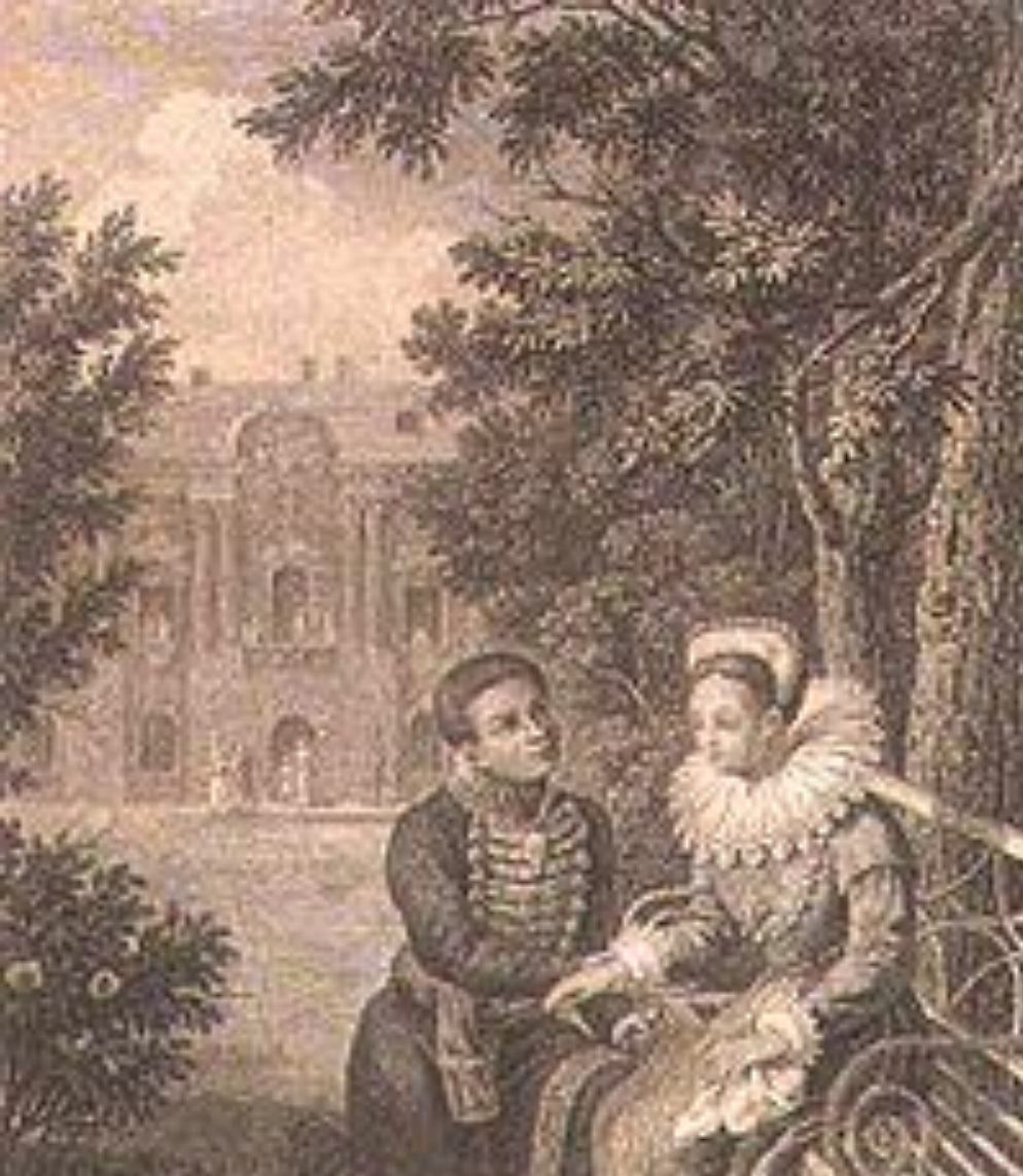
Лжедмитрий I и Марина Мнишек