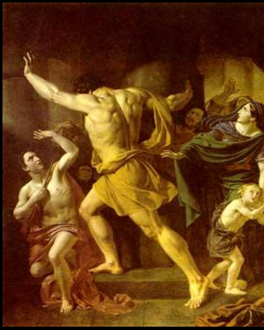
Самсон разрушает храм филистимлян.

Один из евреев Самсон обладал огромной силой. Он полюбил красавицу Далилу и та узнала, что его сила кроется в волосах. Спящего Самсона остригли и связали. Он был ослеплен и брошен в темницу. Филистимляне устроили пир и стали издеваться над Самсоном. Но его волосы уже отрасли. Самсон схватился за колонны и обрушил здание.