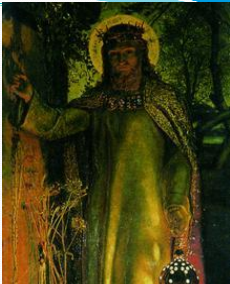
У. Х. Хант. Светоч мира (фрагмент). 1853