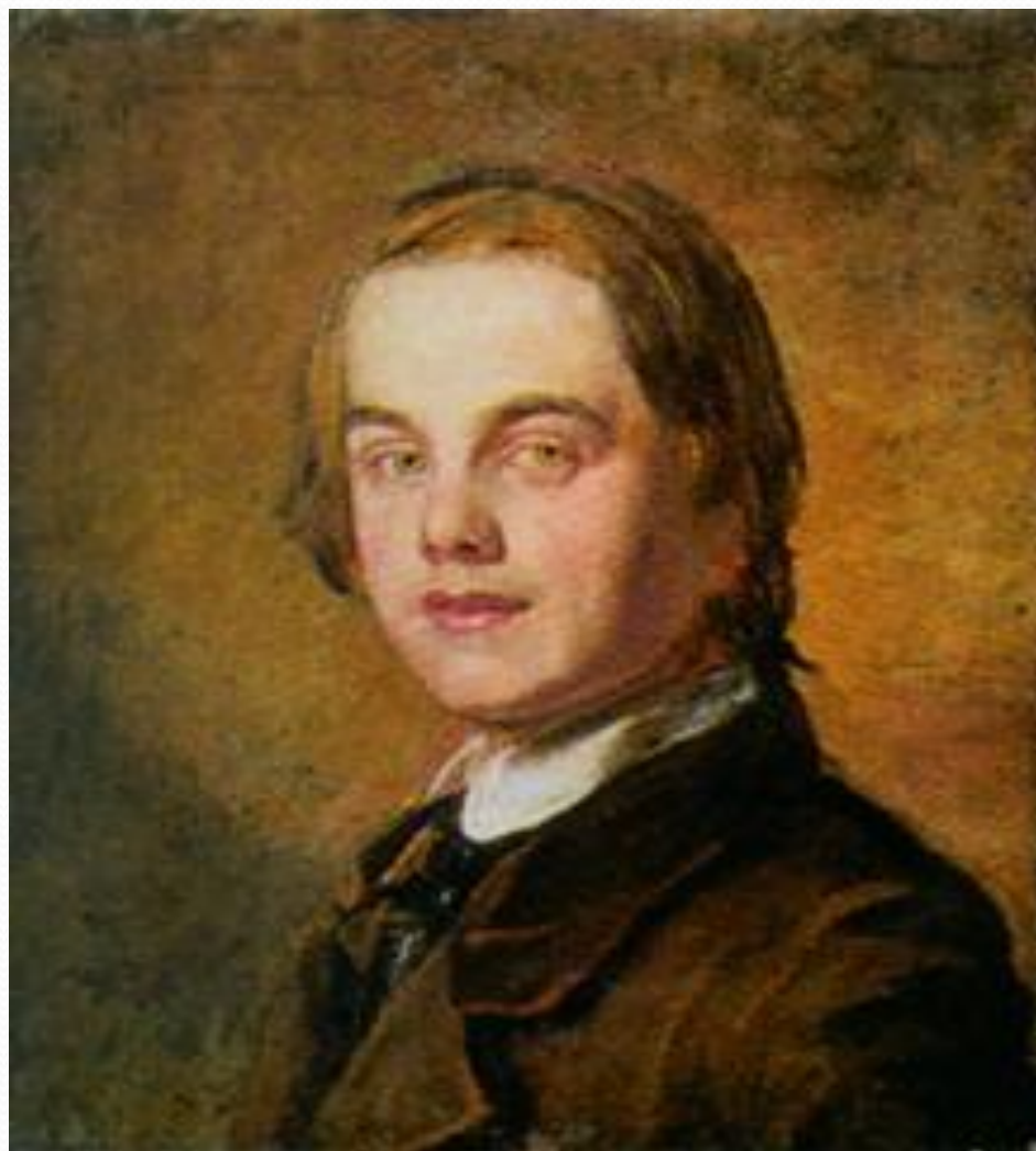
Уильям Холман Хант. Автопортрет. 1845