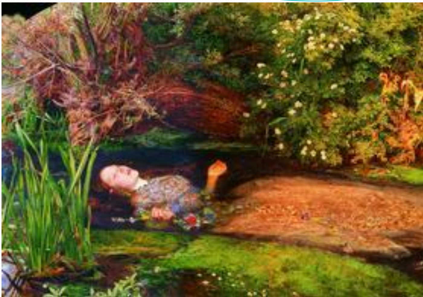
Дж. Э. Миллес. Офелия. 1852