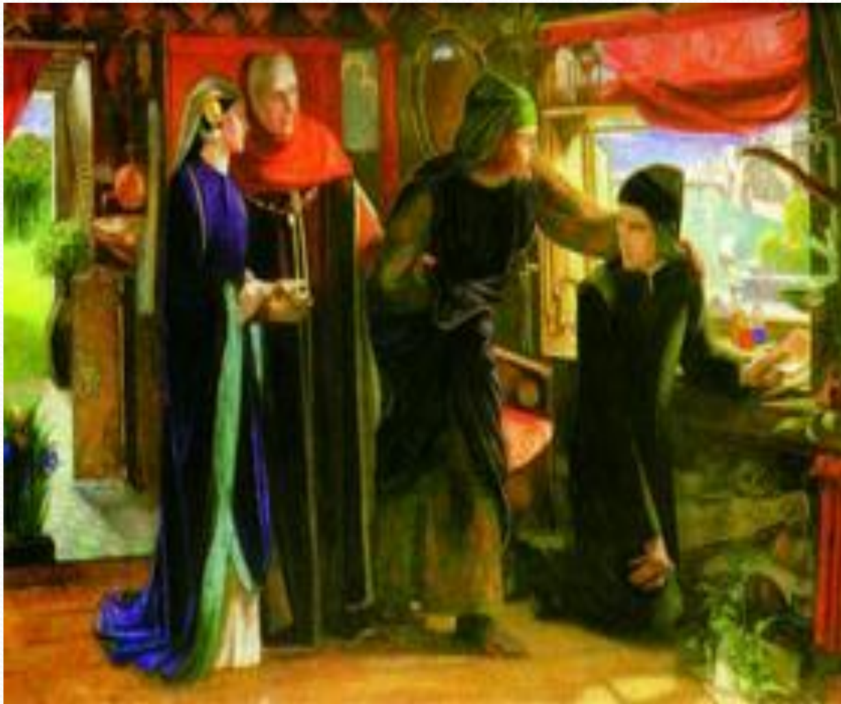
Д. Г. Россетти. Первая годовщина смерти Беатриче. 1854