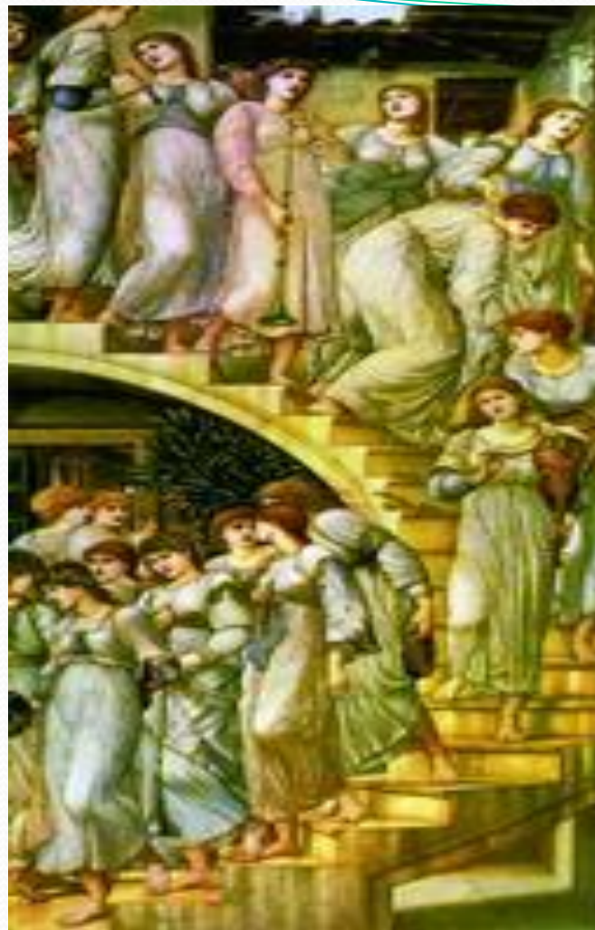
Э. К. Бёрн-Джонс. Золотые ступени. 1880