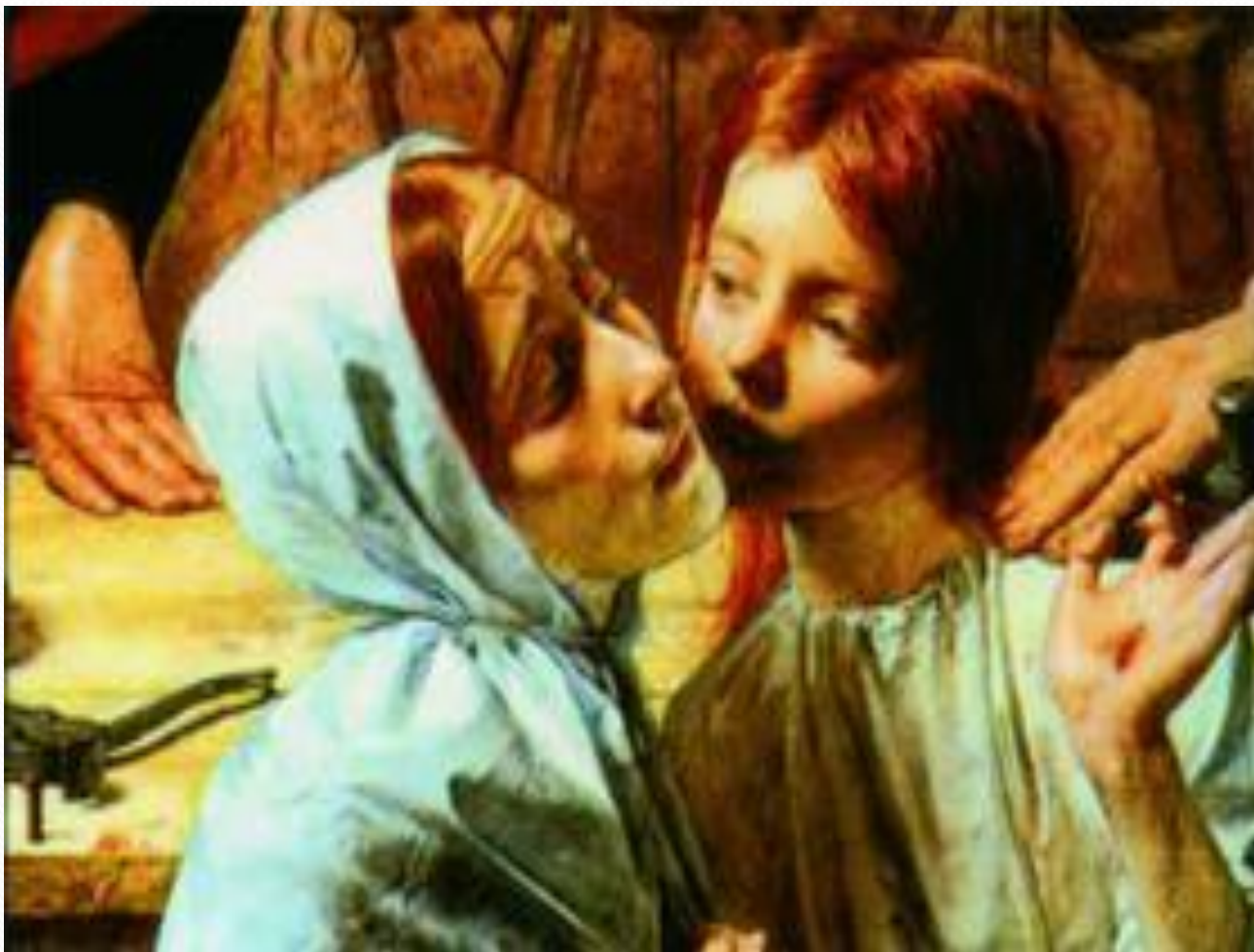
Д. Э. Миллес. Христос в доме своих родителей (фрагмент). 1850