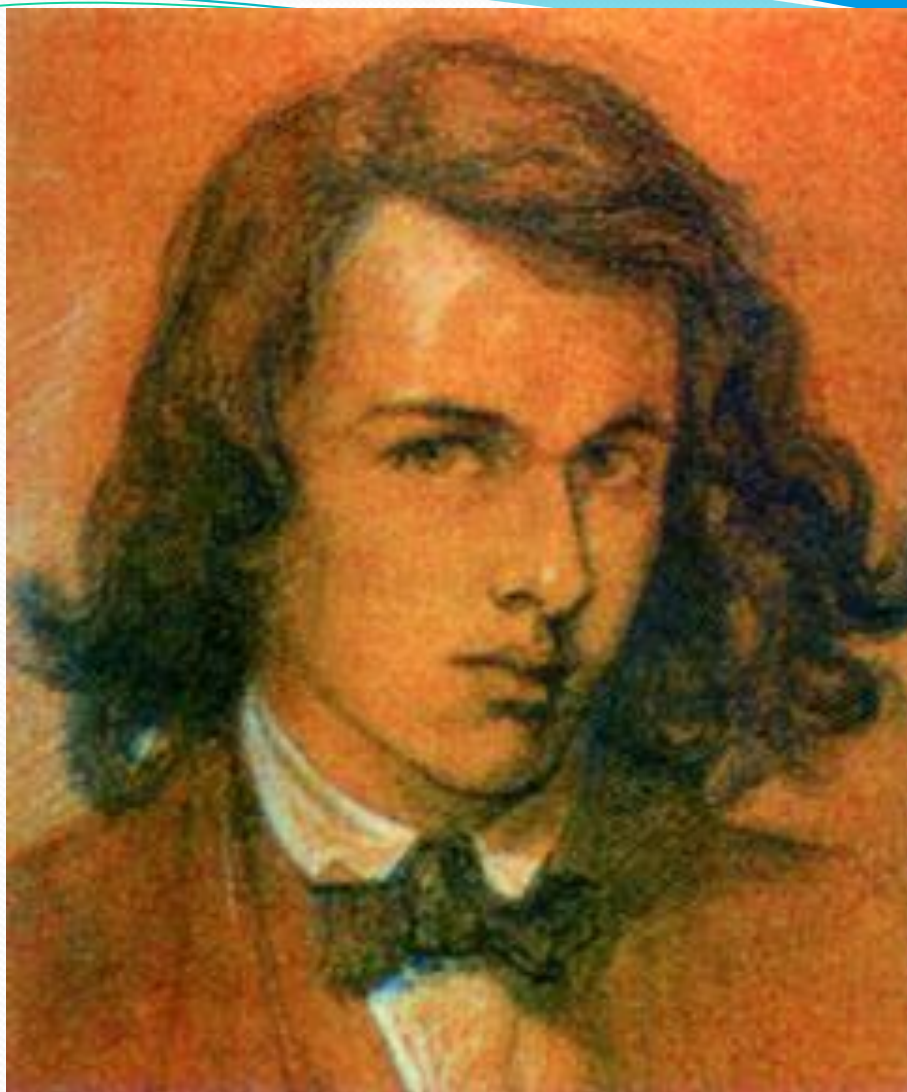
Данте Габриэль Россетти. Автопортрет. 1847