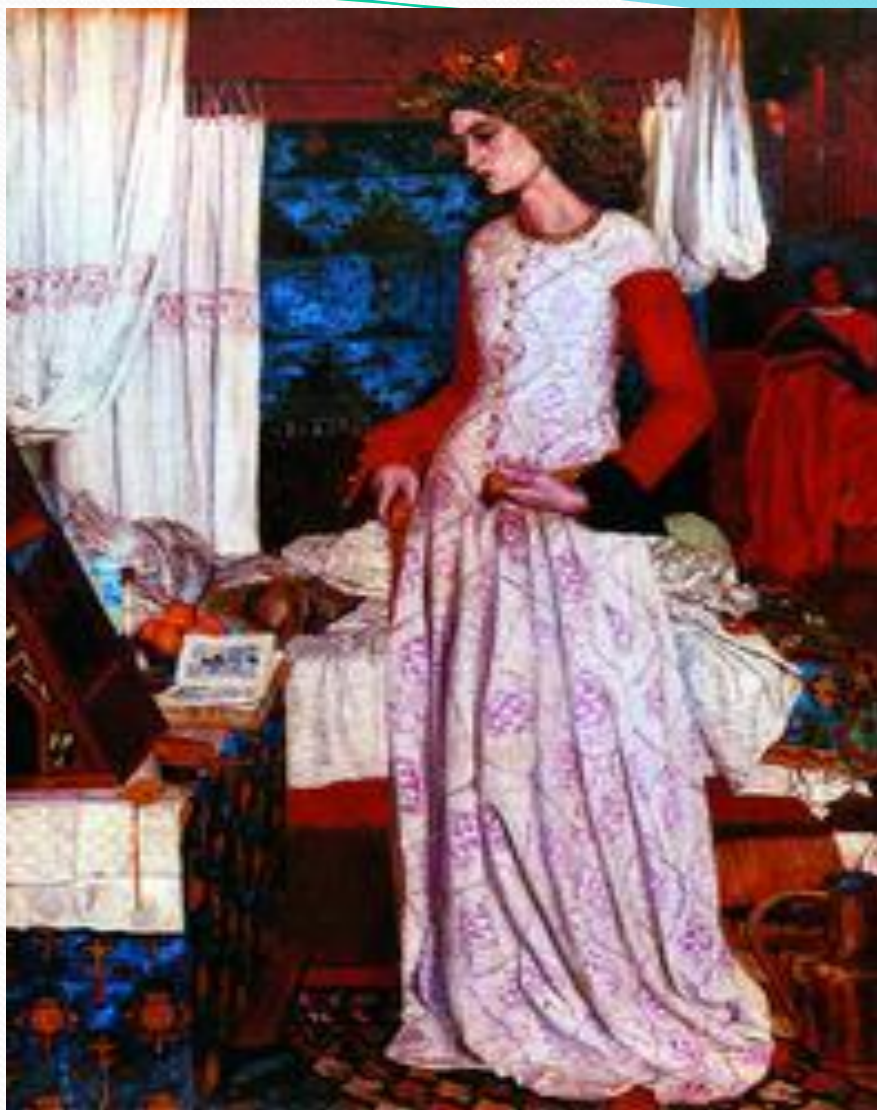
У. Моррис. Королева Гвинивера. 1857