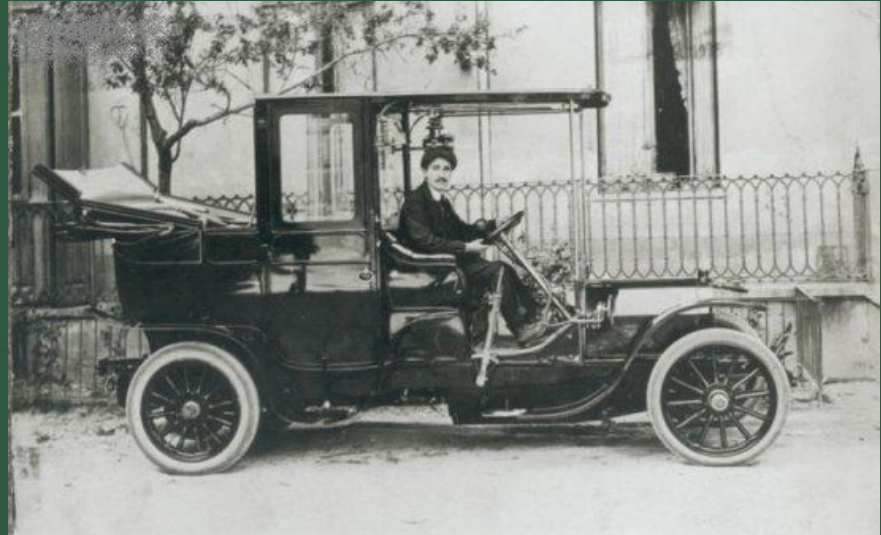
Автомобильная фирма «Фиат»