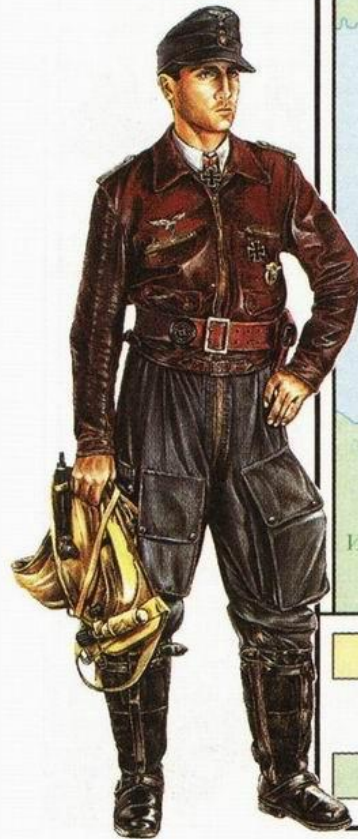
Немецкий военный лётчик времён Второй мировой войны.