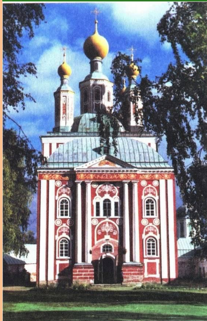
Рождество-Богородицкий собор в Санаксарском монастыре