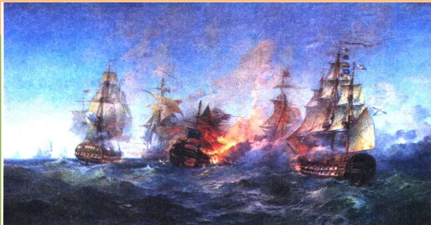
Сражение у острова Тендра. Художник А. Блинков