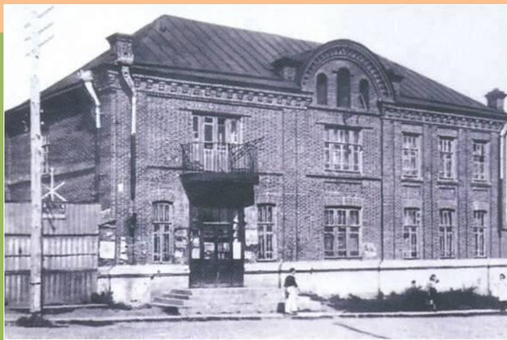
Здание кинотеатра «Художественный»