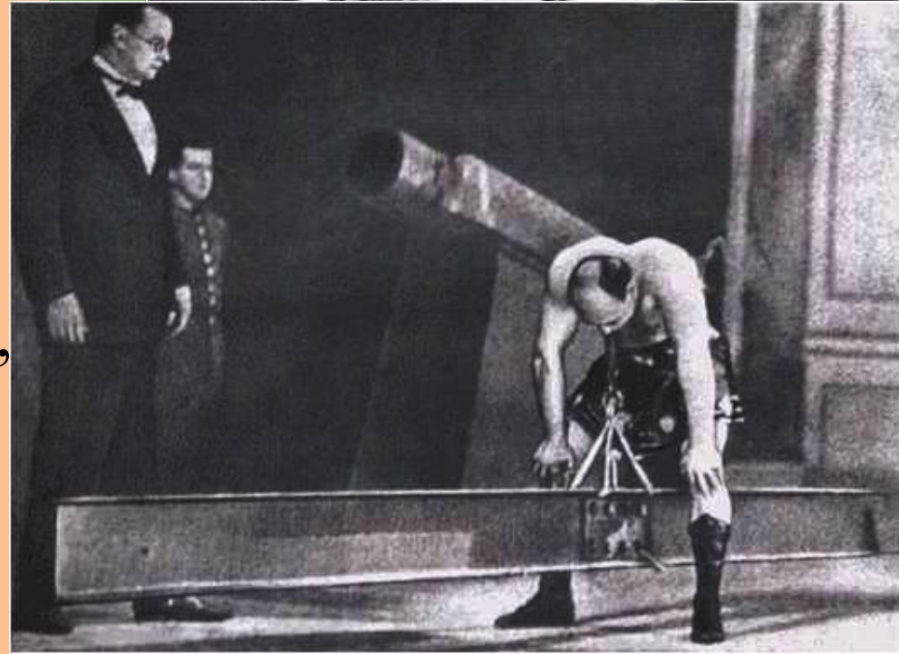
Александр Иванович Засс «Железный Самсон»