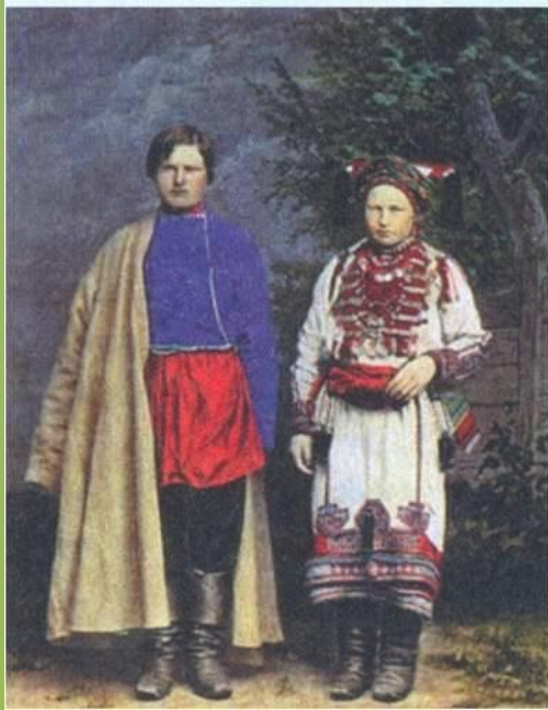
Мордва. Художник М. Букарь