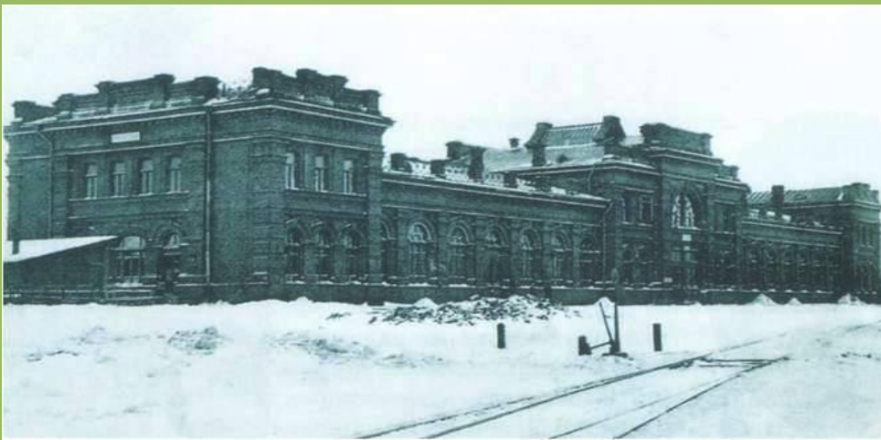
Рузаевский вокзал. Фото начало XX века.