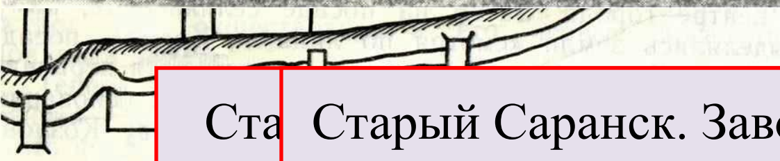
Старый Саранск. Заводская улица.