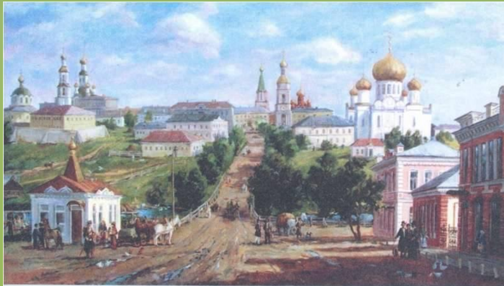
Старый Саранск (XIX в.). Художник М. Ямбушев

Города и деревни мордовского края в конце XIX – начале XX веков.