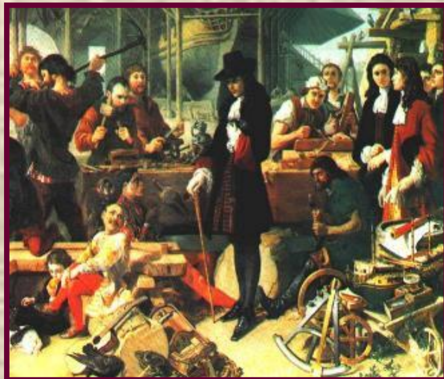
Петр I на верфи в Англии. Современный рисунок.