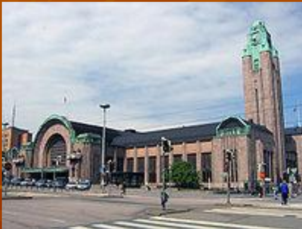
Центральный вокзал Хельсинки