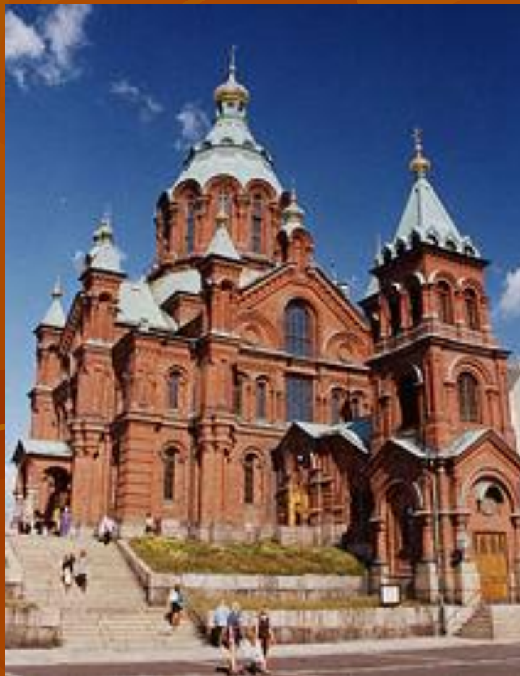
Успенский православный собор в Хельсинки.