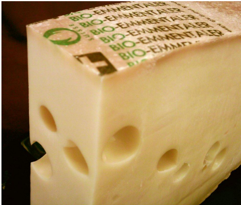
Эмменталь (emmental) Традиционный французский сыр из коровьего молока.