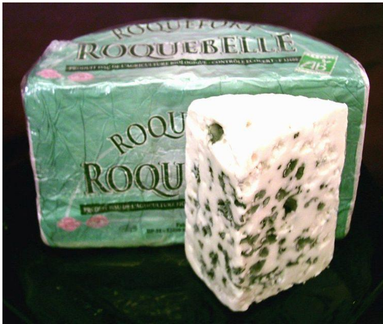
Рокфóр ( Roquefort ) сорт французского сыра, относящийся к голубым сырам

Сыры с плесенью внутри (fromages à pâte persillée).