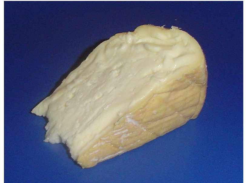
Мю́нстер ( Munster ) французский сыр из коровьего молока также с отмытой корочкой, является одним из древнейших в Европе.