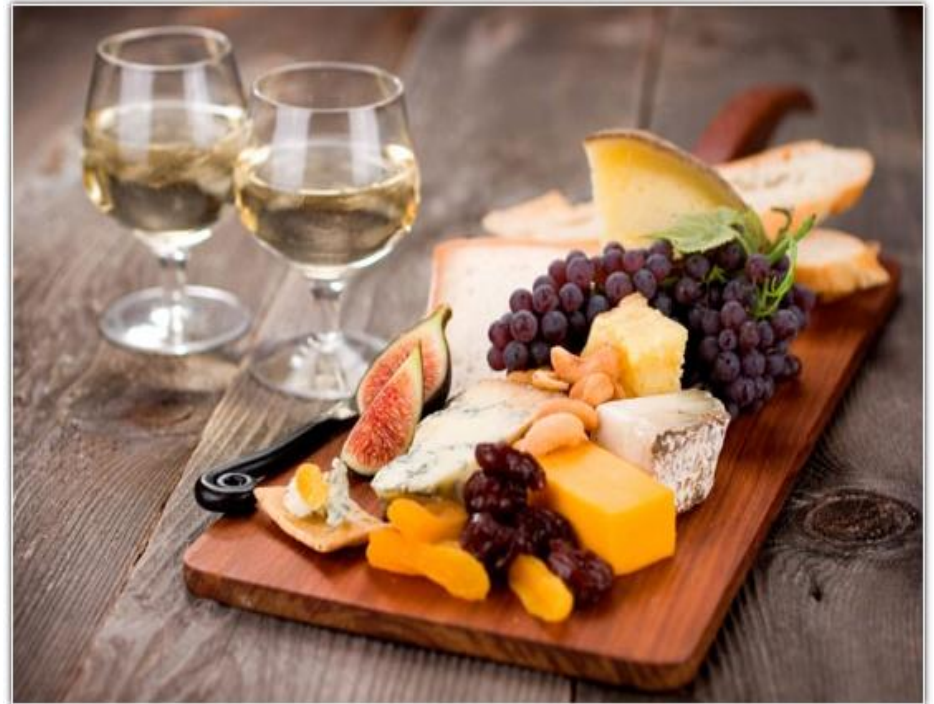
Конте (comté) Французский сыр из пастеризованного коровьего молока, производимый в регионе Франш-Конте