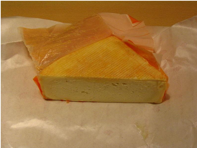
Маро́й ( Maroilles ) французский сыр из коровьего молока с мягкой упругой мякотью и отмытой корочкой. Сыр часто называют «Чудо Мароя»

Мягкие сыры ( fromages à pâte molle ). Это самые употребляемые сыры во Франции.