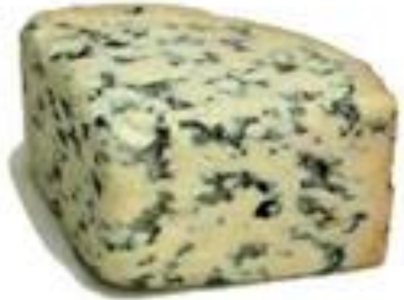
Фурм д'Амбер Французский сыр из коровьего молока, который считается одним из самых нежных сыров с голубой плесенью. Он обладает пряным пикантным ароматом и вкусом.