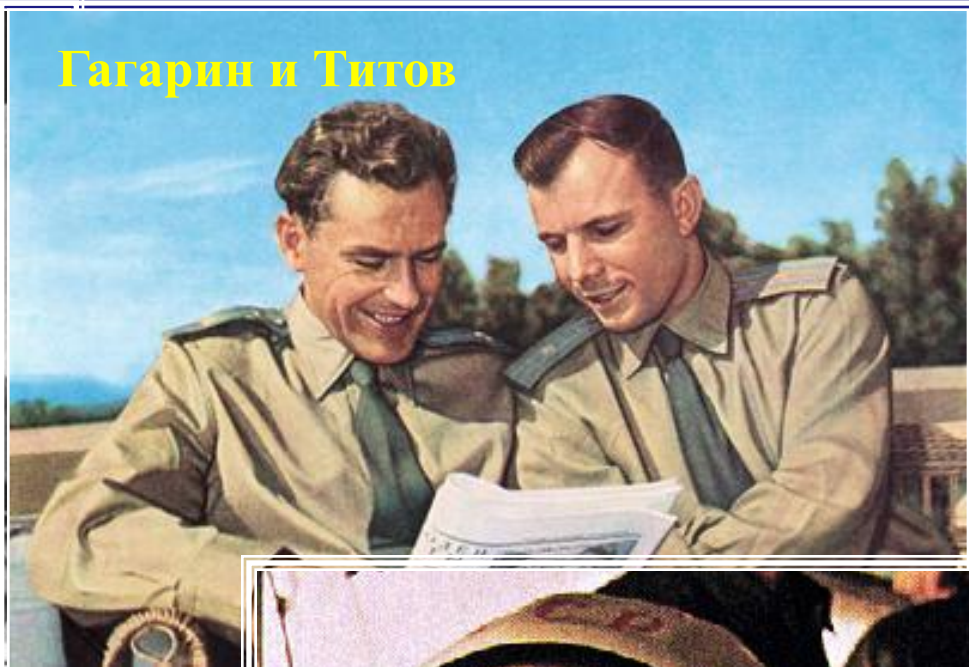
Гагарин и Титов

Кроме Гагарина, были ещё претенденты на первый полёт в космос, всего было двадцать человек. Они обладали отменным здоровьем. Но того, кто полетит в космос, определили в последний момент, на заседании ГК, ими стали Гагарин и его дублёр Герман Титов