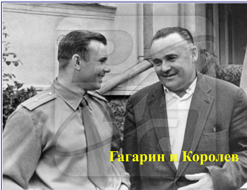
Гагарин и Королёв