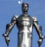
Памятник Юрию Гагарину в Москве