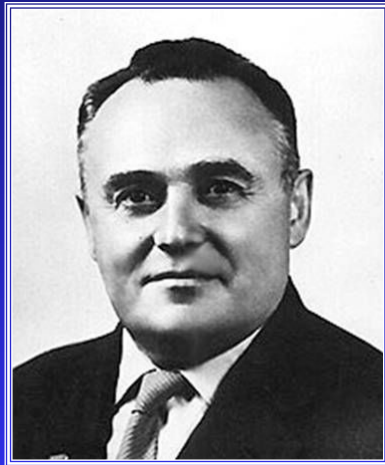
Сергей Павлович Королев