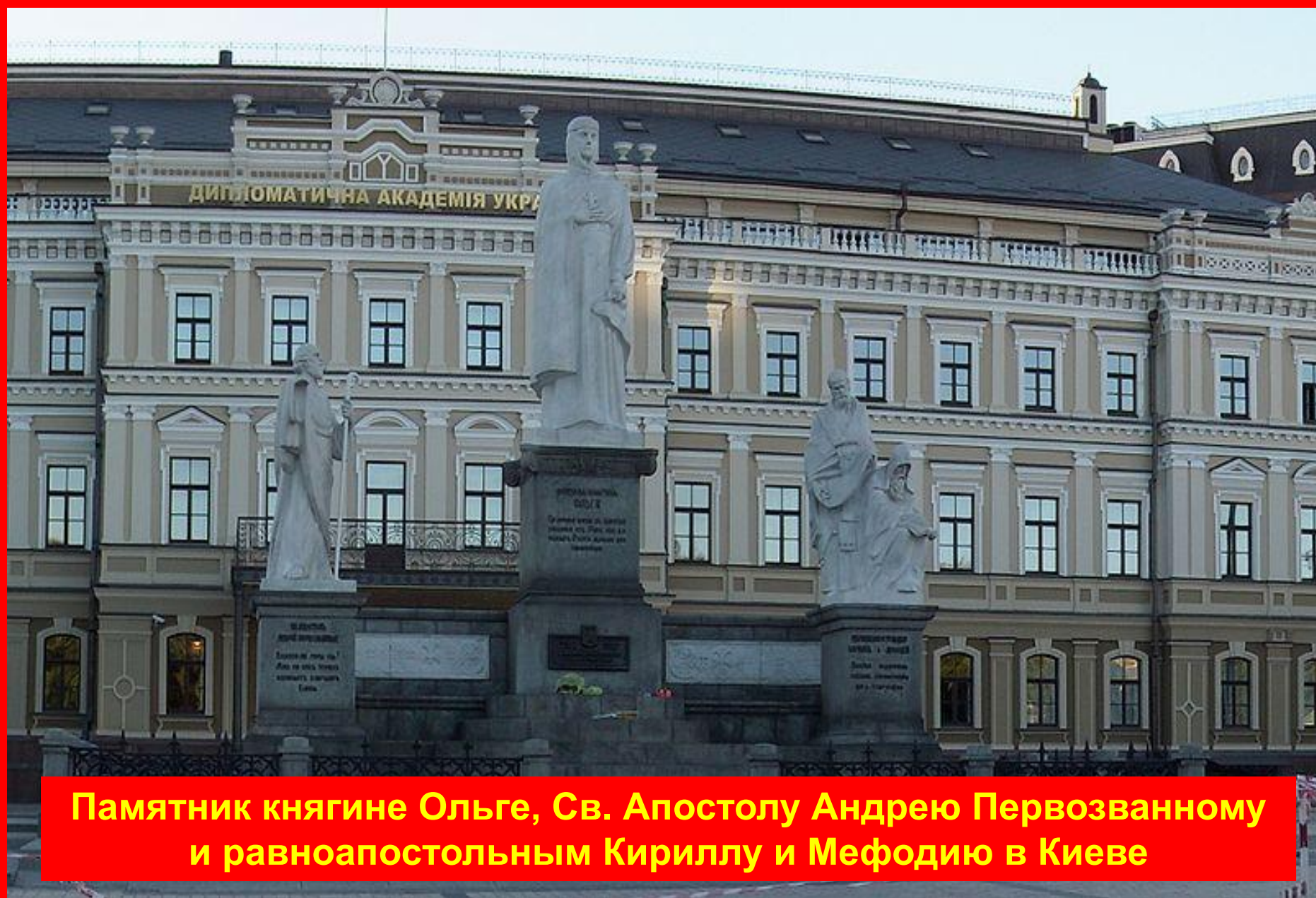
Пам'ятник княгині Ользі, Св. Апостолу Андрію Первозванному і равноапостольним Кириллу і Мефодію в Києві