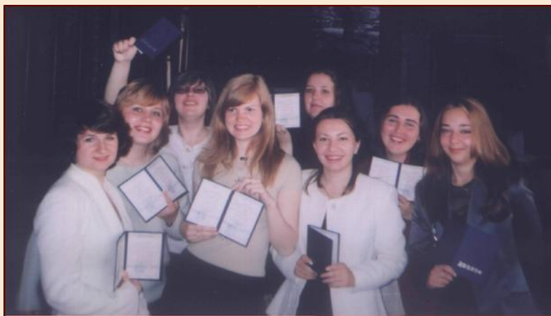
Выпускники кафедры с заслуженными дипломами

И только так – через упорство и смекалку, знания и интеллект, расширение кругозора и востребованные жизнью проекты – кафедра будет продолжать оказывать стимулирующее воздействие на развитие национального туризма.