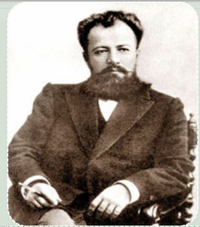
В.И. Немирович- Данченко