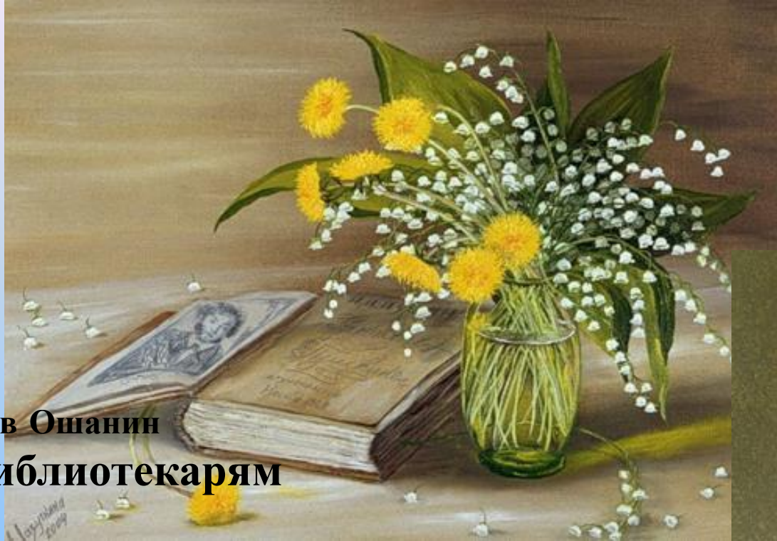
Лев Ошанин Библиотекарям

Книжные люди, друзья мои ближние, Верные слуги и маршалы книжные. Милые тихоголосые женщины, В книгах - всеведущи, в жизни - застенчивы. Душ человеческих добрые лекари, Чувств и поступков библиотекари. Кажется вы мне красивыми самыми, Залы читален мне видятся храмами. Кто мы без вас? Заплутавшие в замети Люди без завтра и люди без памяти