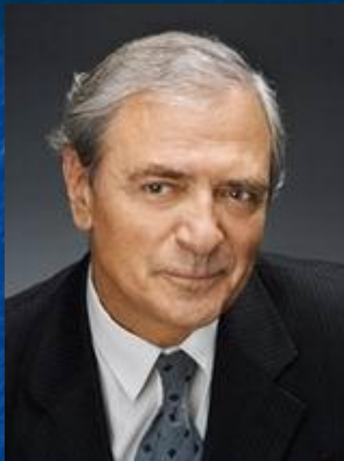
ЛАЗАРЕВ Александр Сергеевич 03.01.1938, Ленинград - 02.05.2011, Москва