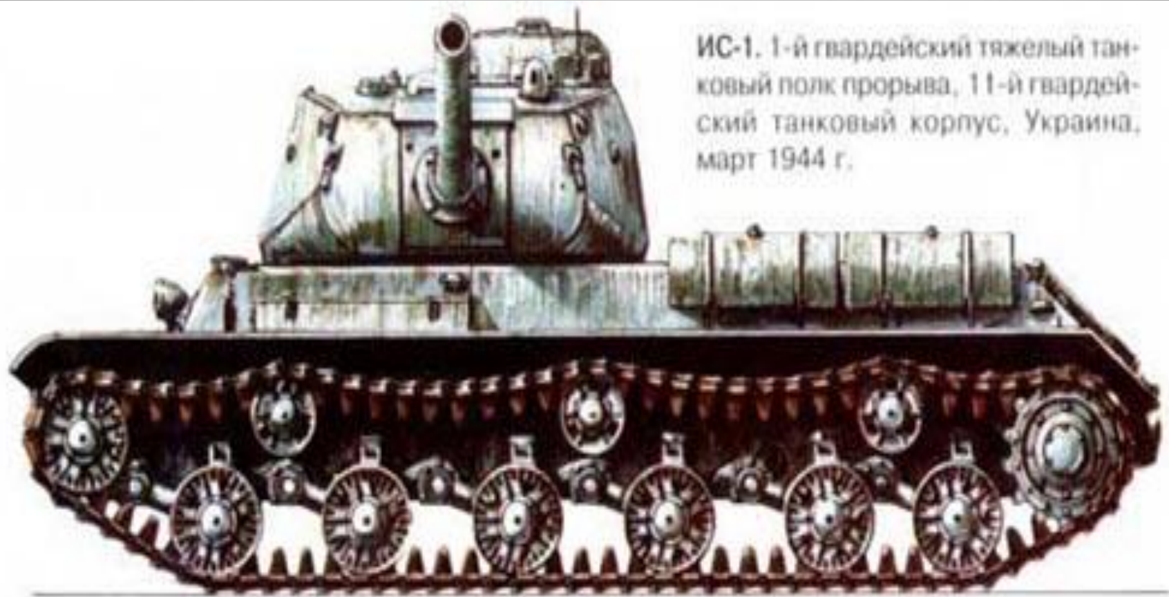
ИС-1. 1-й гвардейский тяжелый танковый полк прорыва, 11-й гвардейский танковый корпус, Украина, март 1944 г.