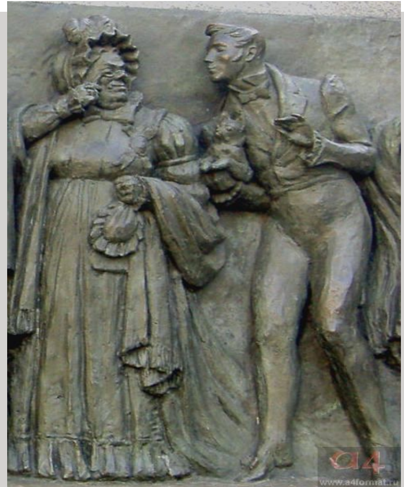
Молчалин и Хлестова