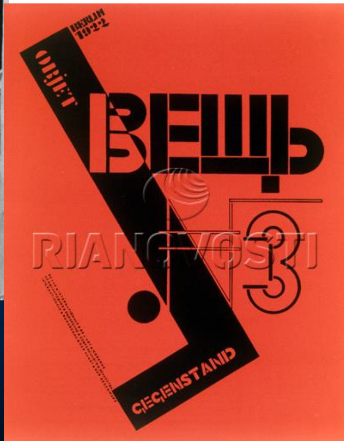
Репродукция обложки международного журнала искусств, основанного художником Элем (Лазарь Маркович) Лисицким и писателей Ильей Эренбургом "Вещь". 1922 год