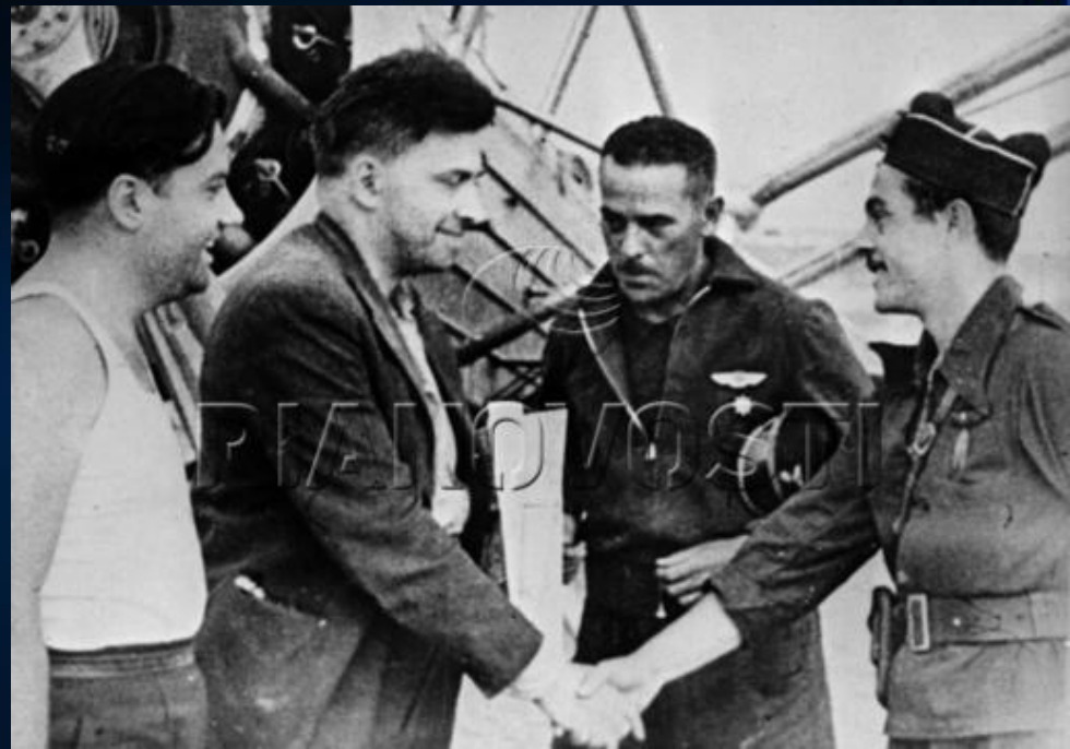
Репродукция фотографии писателя Ильи Эренбурга на аэродроме в Каталонии (Испания).