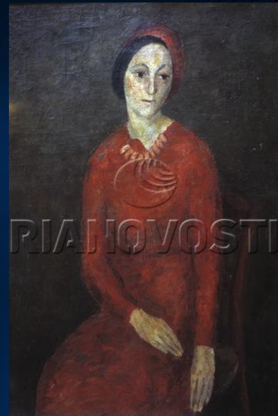
Роберт Фальк. Картина "Портрет жены писателя Ильи Эренбурга".