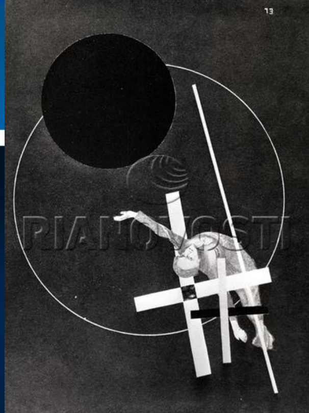
Иллюстрация Эля Лисицкого к книге Ильи Григорьевича Эренбурга (1891-1967) "Шесть повестей о легких концах". Издательство Москва.; Берлин: Геликон, 1922 год. Репродукция.