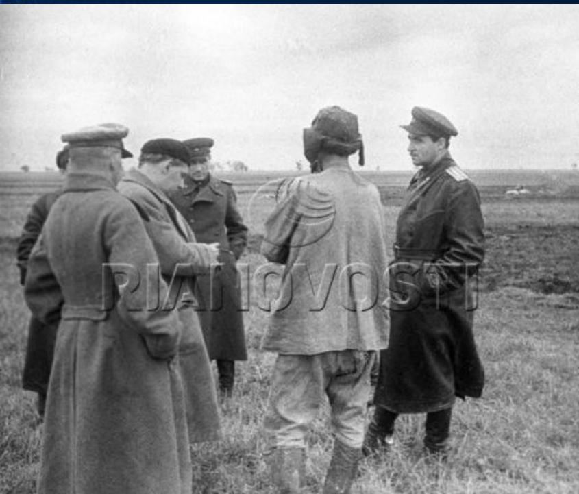
Советские писатели И. Эренбург и К. Симонов (справа) на фронте в Белоруссии. Фотография 1943 года.