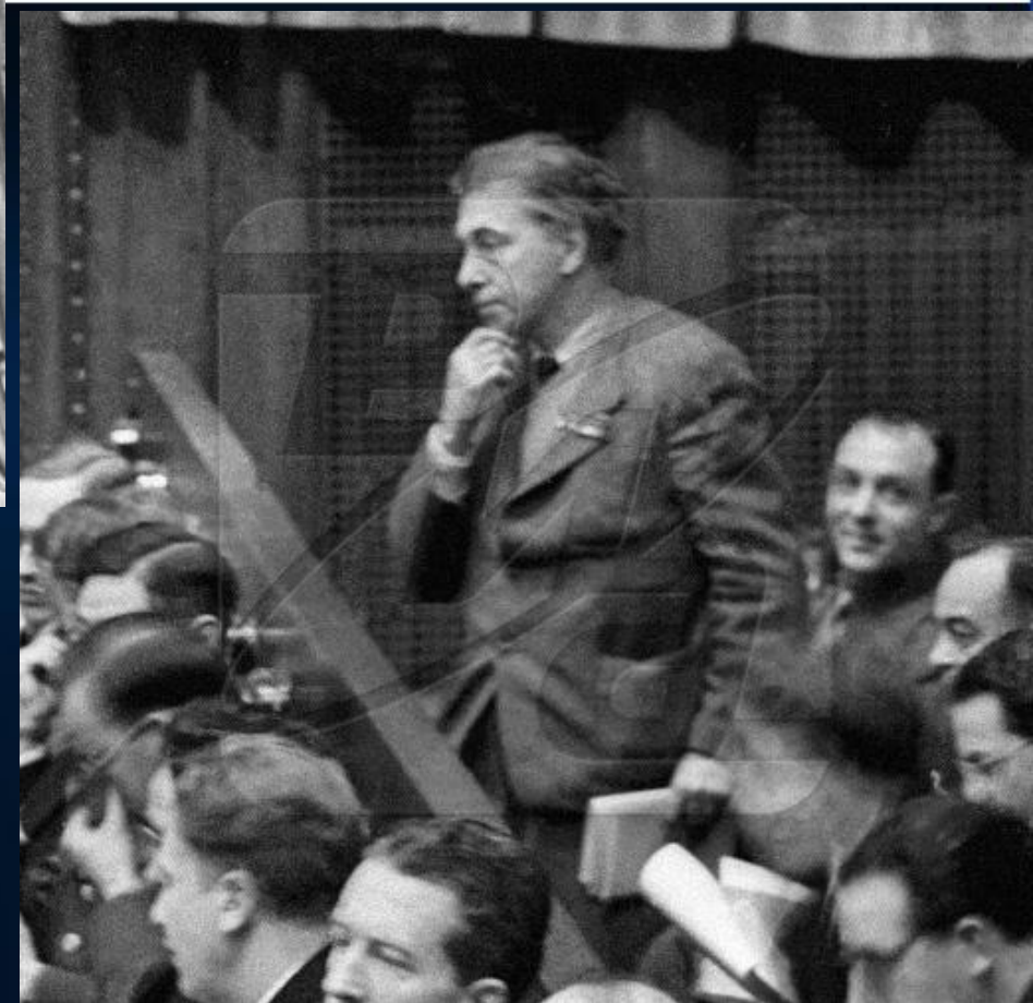
Илья Эренбург в зале заседаний Международного Военного Трибунала на Нюрнбергском процессе. 1945 г.