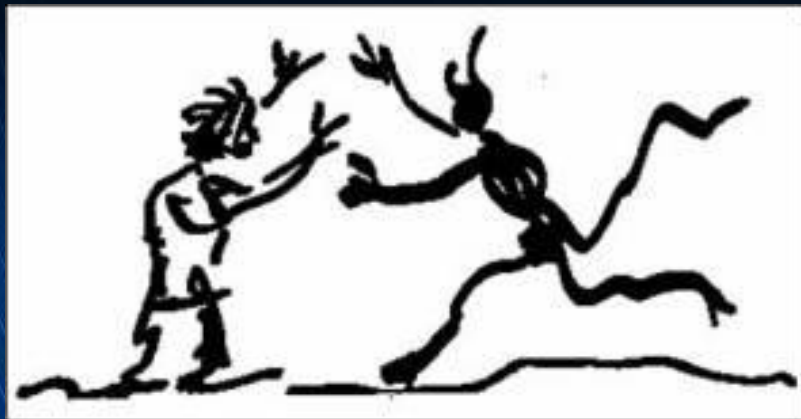
Шарж Пикассо, в котором он изобразил себя и Эренбурга

Во Франции Эренбург жил очень бедно. По воспоминаниям Максимилиана Волошина, «материальное положение Ильи Э. было ужасно. Он ходил, чтобы подработать, ночным носильщиком на вокзал Монпарнас и возил вагонетки до рассвета. При его слабосильности и болезненности — меня это приводило в ужас».