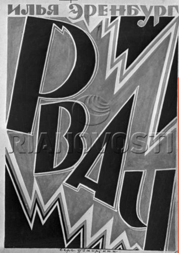
Репродукция обложки книги Ильи Эренбурга "Рвач"