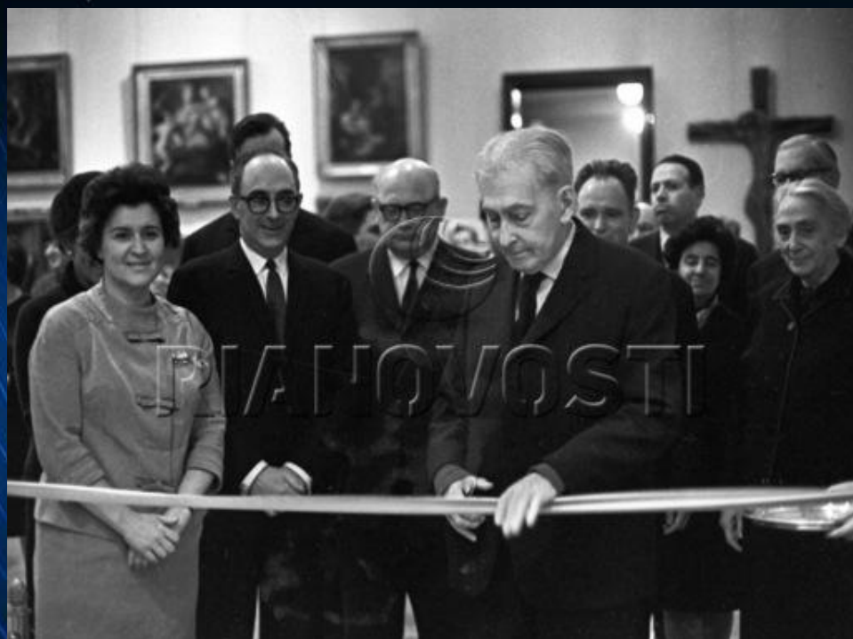
Илья Григорьевич Эренбург открывает выставку произведений Пабло Пикассо в Музее изобразительных искусств имени А. С. Пушкина.

В 1955-1957 гг. Эренбург написал ряд литературно-критических эссе о французском искусстве под общим названием "Французские тетради". В 1956 г. он добился проведения в Москве первой выставки Пабло Пикассо.