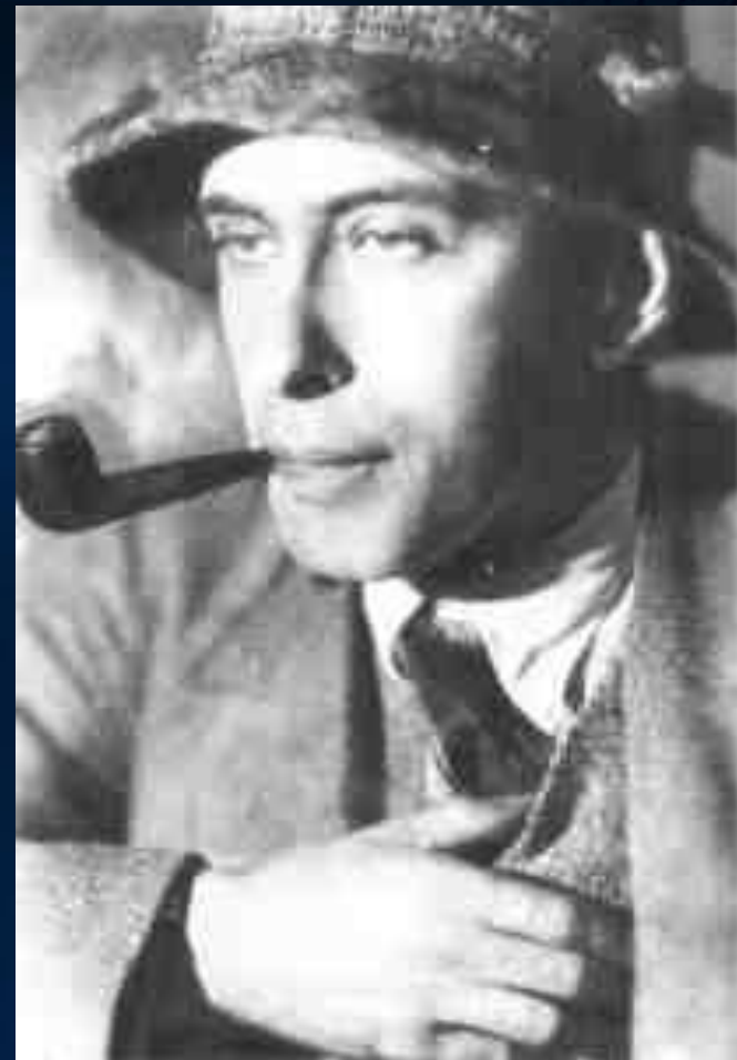
Илья Эренбург в 20-е годы