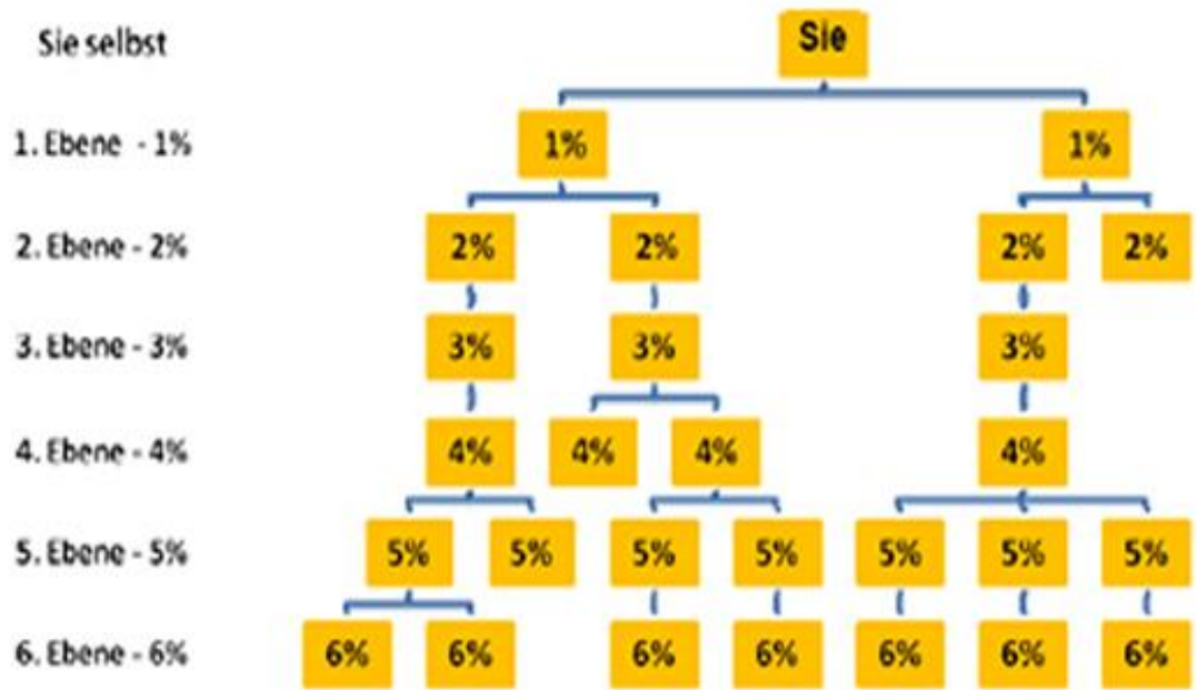
Schaubild: Aufbau eines eigenen Teams

7. Ebene und tiefer: Bis 1% Tiefenbonus auf den Gesamtumsatz Ihrer kompletten Downline (offene Linien) ab der 7. Ebene .