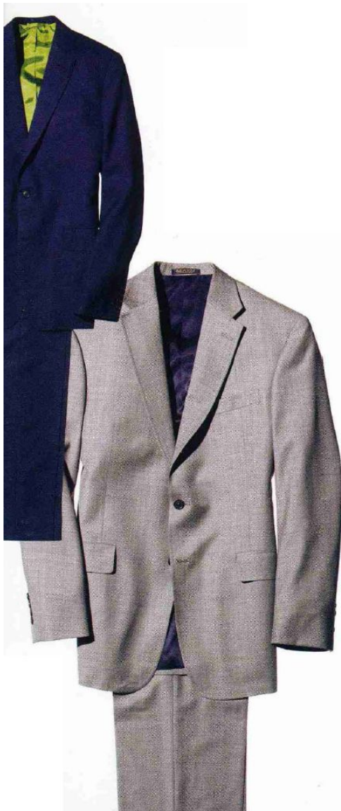
Однорядные костюмы серого и темно-синего цветов