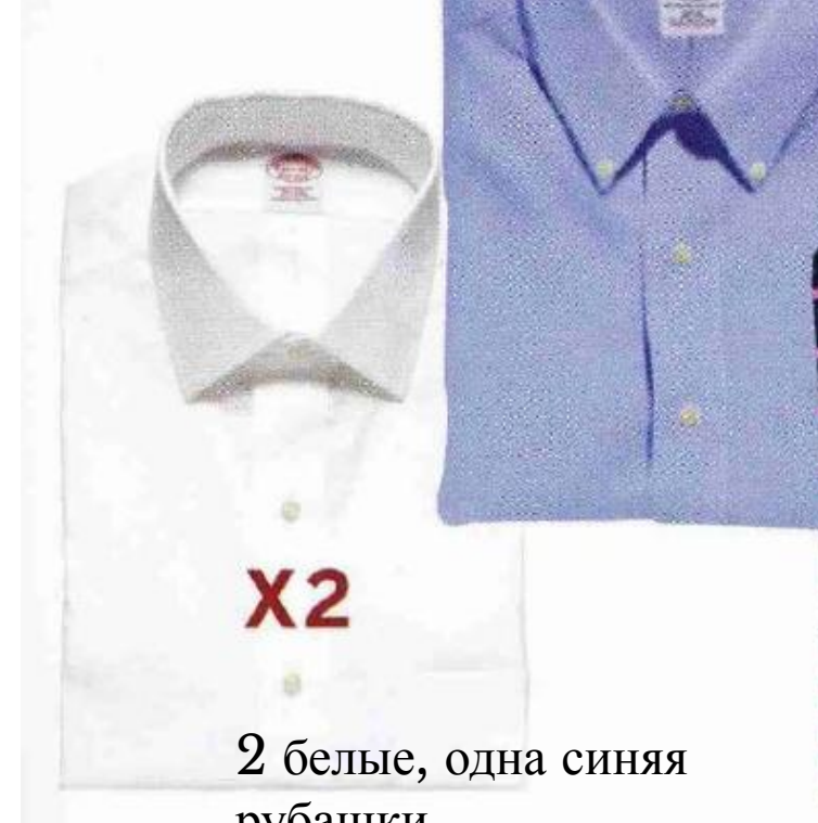
2 белые, одна синяя рубашки,