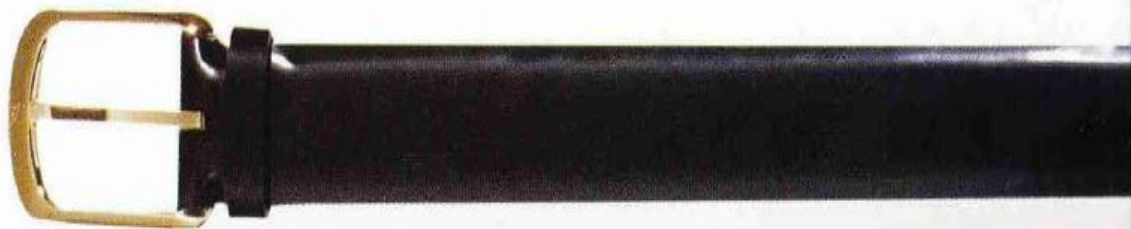
Простой черный ремень