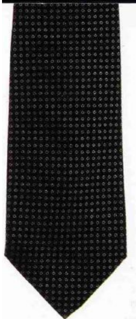
Темный узкий галстук