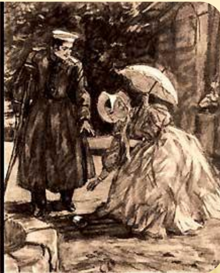
М. Врубель. Княжна Мери и Грушницкий. 1890.