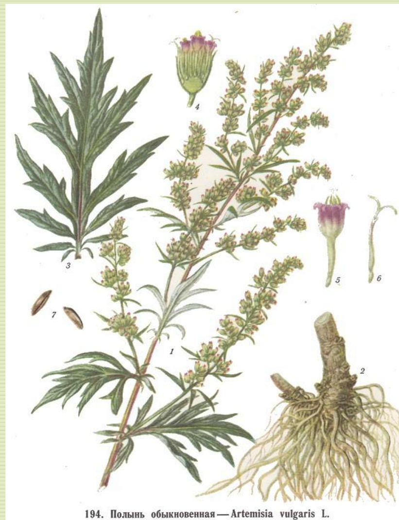
194. Полынь обыкновенная — Artemisia vulgaris L.

Трава чернобыльника содержит эфирные масла, витамины, дубильные, слизистые и смолистые вещества, а корни - эфирные масла, слизистые и сахаристые вещества. Высушенная трава имеет острый аромат, слегка горький и терпкий вкус. У корней тот же аромат, но вкус сладковато-острый.