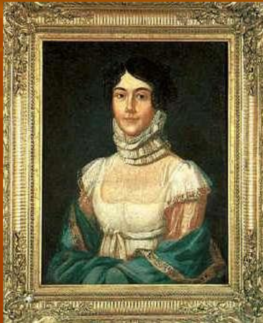
Ю.П.Лермонтов. М.М.Арсеньева (Лермонтова).