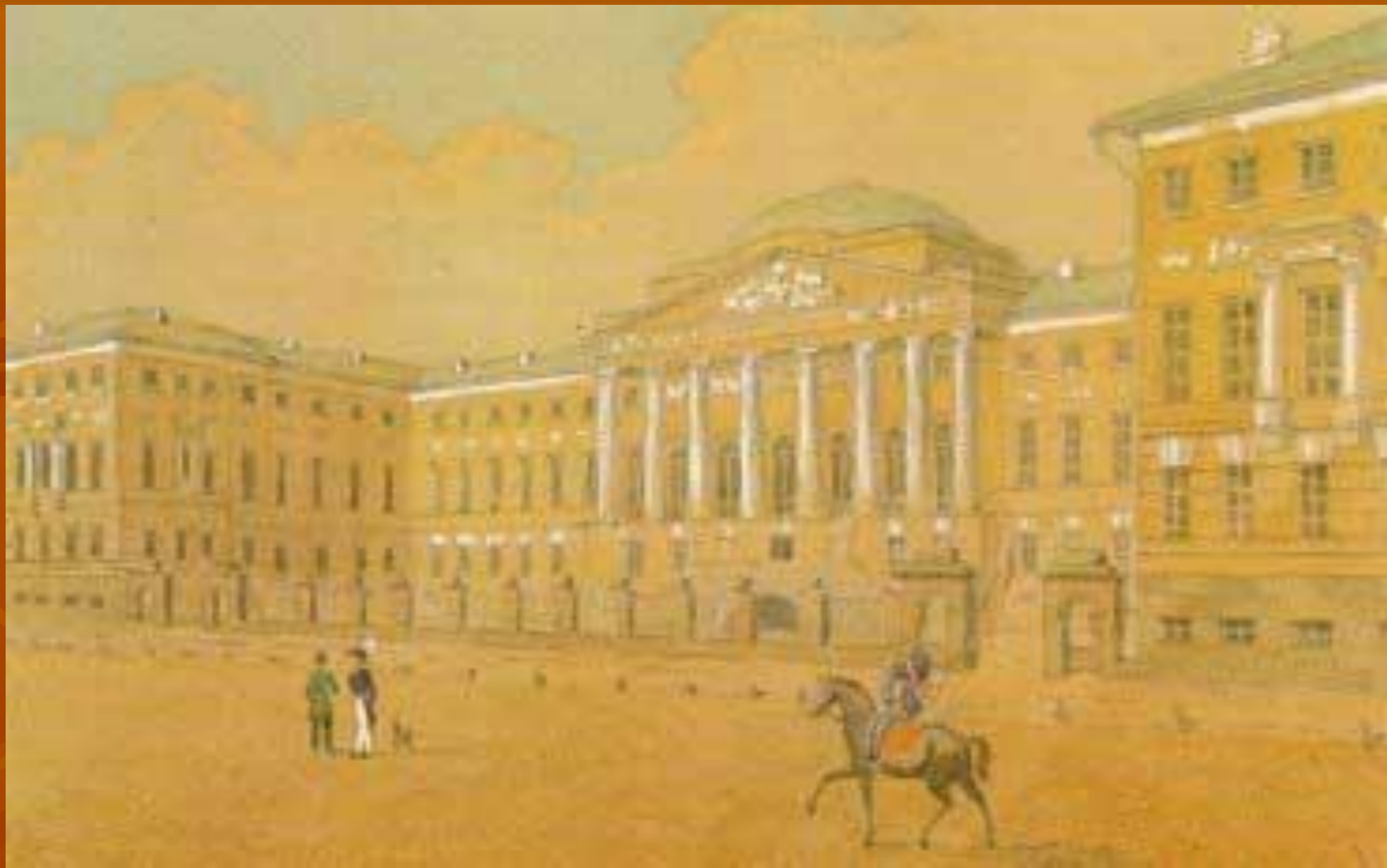
Москва. Благородный пансион при Московском университете.