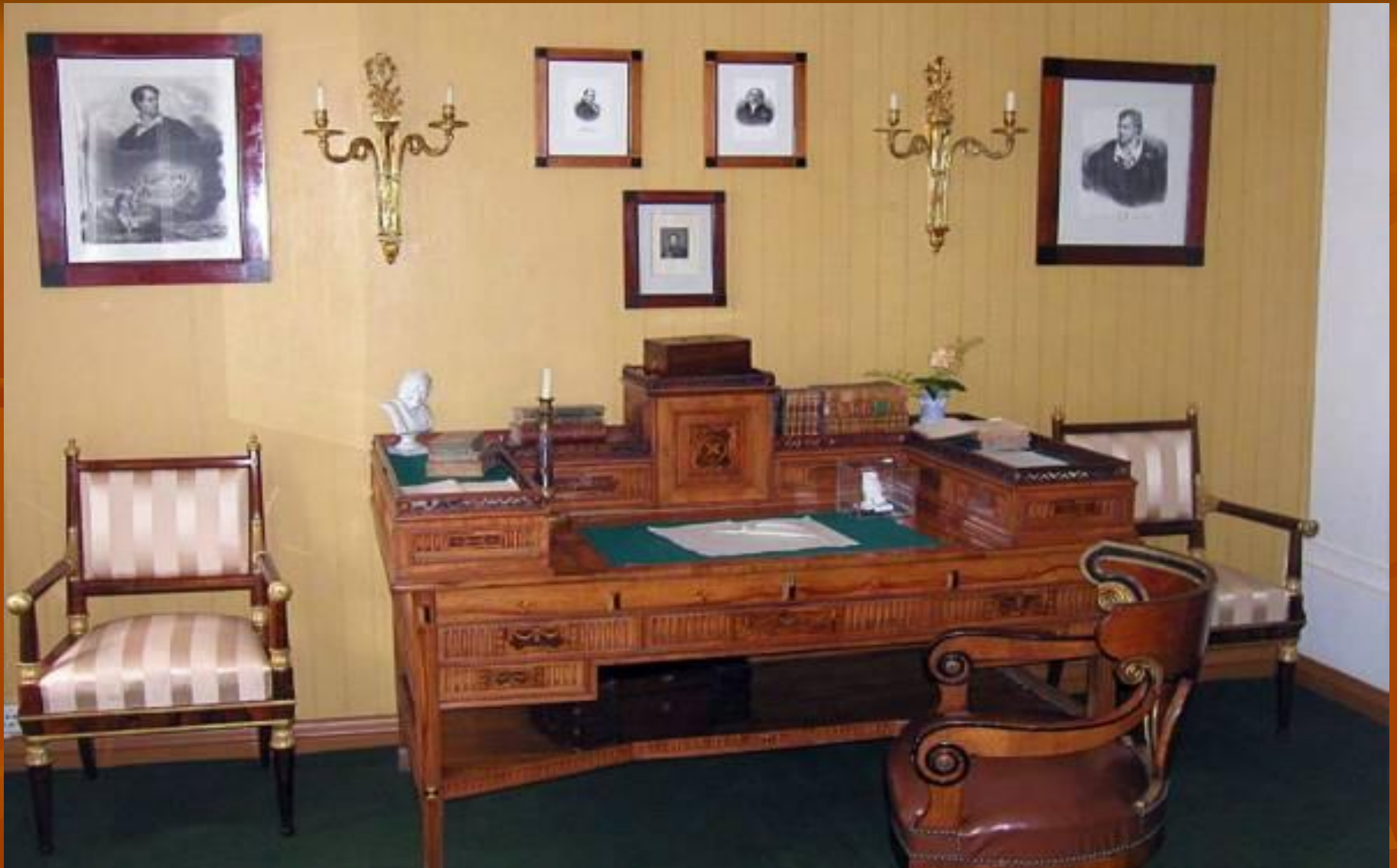
Рабочий кабинет поэта в Тарханах.